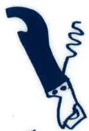
Can opener 缶きり