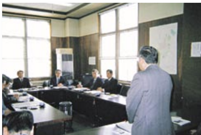
▼会津若松市の景観条例と地域の活性化について説明を受ける建設委員