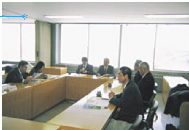
▲市立図書館の概要等について担当職員より説明を受ける（岩見沢市）