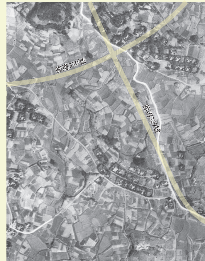
Aerial photograph taken by US military forces ON24146 054-1