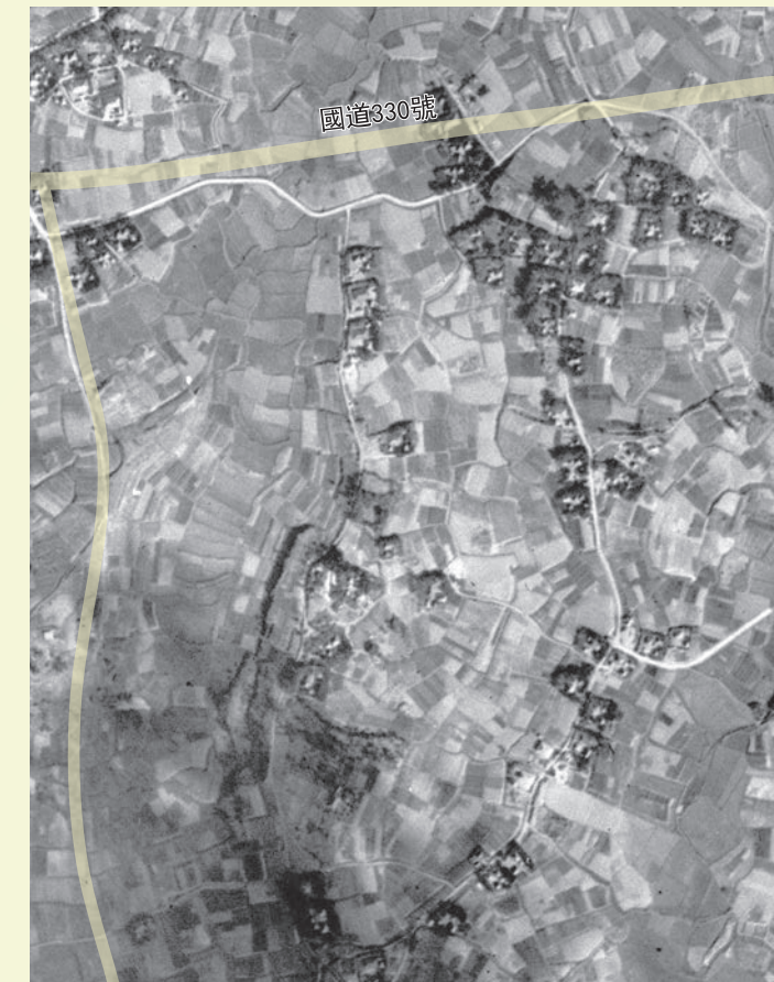
Aerial photograph taken by US military forces ON24146 019-2