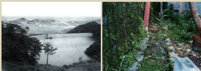
Goeku Dam in 1957 (from Goya no Konjaku Shashinshi)

然而，進入1960年代後，安慶田的水田被改建為住宅地，越來水壩失去了它的作用。如今，在安慶田的住宅區的某個角落，還可以依稀看到水渠的細微痕跡。