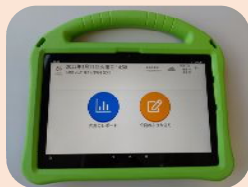
みまもりタブレット(10インチ)

※ご家庭のコンセントと有線接続します。 ※間取りの状況を確認し、3個それぞれ別の場所に設置させていただきます。 ※壁掛け設置可。(要ネジ止め)