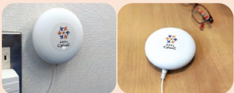
みまもりセンサー(直径10cm、厚さ3cm)

※ご家庭のコンセントと有線接続します。 ※間取りの状況を確認し、3個それぞれ別の場所に設置させていただきます。 ※壁掛け設置可。(要ネジ止め)