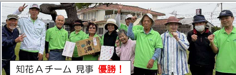
知花Aチーム 見事 優勝！

各チーム、日頃の練習の成果を発揮すべく頑張りました！90代の参加も14名おられ、みなさんのパワーに脱帽です。楽しく活動・交流することが健康寿命を延ばす秘訣ですね♪