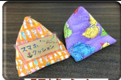
スマホクッション