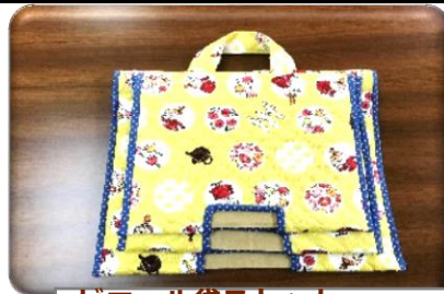
ビニール袋ストッカー