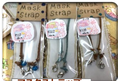
マスクストラップ