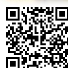
マブイ アゲアゲ 心も↑↑チキアギー!