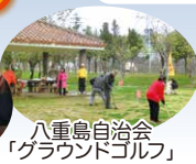
八重島自治会 「グラウンドゴルフ」