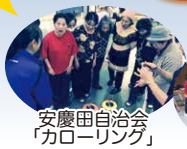
安慶田自治会 「カロリーリング」