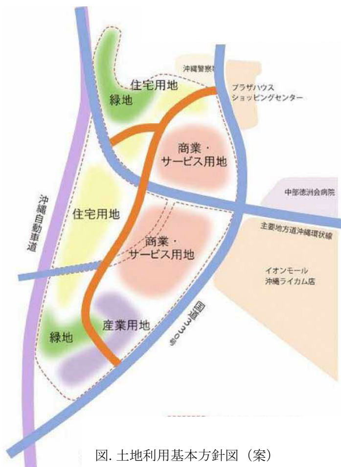
図. 土地利用基本方針図 (案)

今後も、地権者・行政・関係者が連携しながら、まちづくりの具体化に向けた協議・調整を継続する予定であり、返還後、速やかに、土地区画整理事業の組合設立認可を目指します。