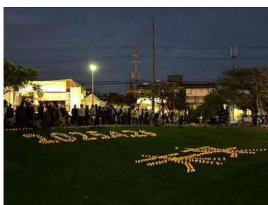
ピースフルキャンドル ナイト