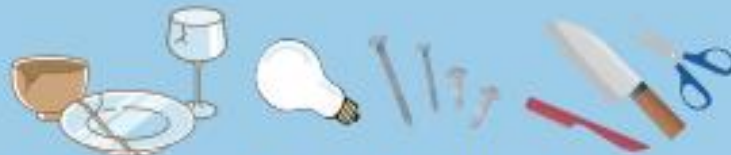
●食器類 (陶磁器、ガラス)