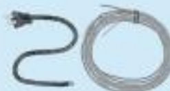
●電気コード・針金類