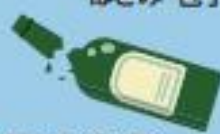
●割れたビン類 資源ごみには出せません。