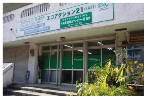
NPO法人 沖縄県環境管理技術センター 外観