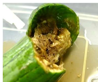
加害されたヘチマ