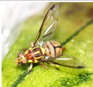
セグロウリミバエ成虫