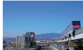
豊中市は人口約40万人の中核市