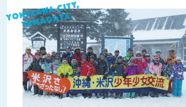
少年少女交流で米沢市を訪れた沖繩市の子どもたち