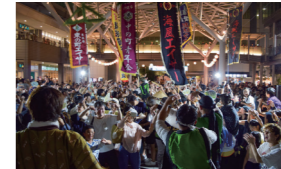
沖繩フェスの最後はカチャーシー