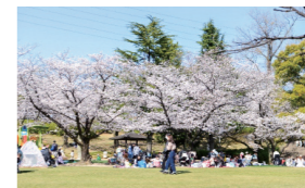
大池公園の桜まつり