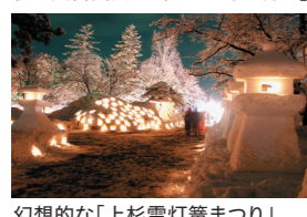
幻想的な「上杉雪灯籠まつり」