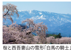
桜と西吾妻山の雪形「白馬の騎士」