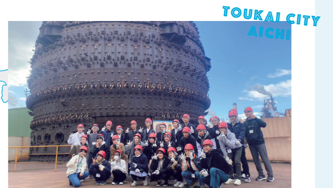
親善交流で日本製鉄所の工場を訪れた沖繩市の中学生