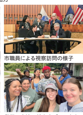
留学で交流の輪を広げています