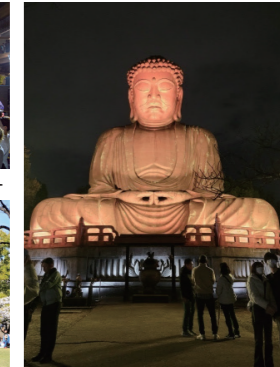
東海市のシンボル「聚楽園大仏」