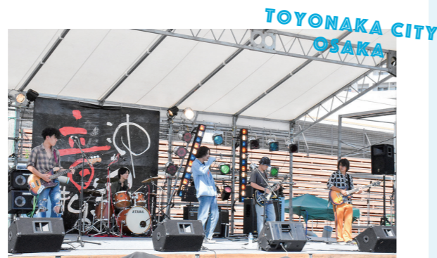
豊中まつりで開催される「沖繩音舞台」