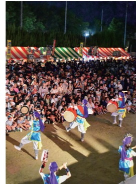
豊中まつりではエイサーも披露