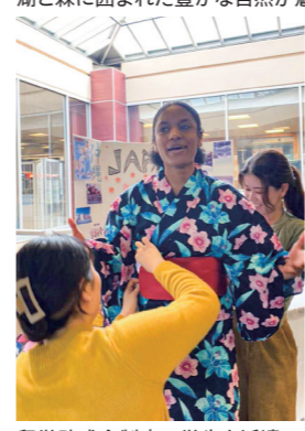
留学助成金制度で学生を派遣