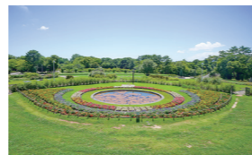
憩いの場になっている服部緑地