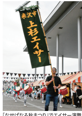
「なせばなる秋まつり」でエイサー演舞