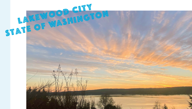
湖と森に囲まれた豊かな自然が魅力