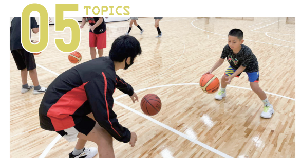
こどもたちがさまざまな遊びやスポーツ、イベントを楽しんでいます

また、沖縄市では貧困の連鎖を断ち切る施策として、自治会等におけるこども食堂の開設及び学習支援や食事提供等を行う団体の支援、若年妊産婦の資格取得に係る費用の助成や生活指導・就学・就労支援などに取り組んでいます。