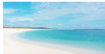
県内最大級となる約900mのロングビーチ