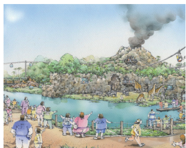
拡張区域のイメージパース①

将来的には、園の南側を拡張し、宿泊施設や新たな観光コンテンツの構想も計画しています。