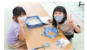
0~18歳まで無料で利用できます