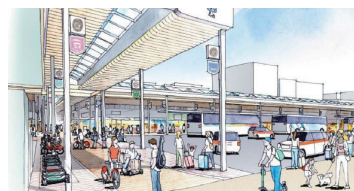
国道330号胡屋・中央地区が人流・物流の交通拠点となることで、公共交通の活性化、経済活動の促進を図ります