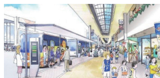
商店街アーケードに面した乗降場により、人々の交流や賑わい創出を図ります

路などへの回遊性を高め、市内外から多くの誘客を図り、賑わい創出、中心市街地の活性化に繋げていきます。