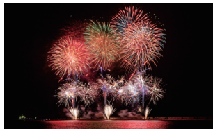
潮乃森をPRする打ち上げ花火