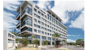
沖縄アリーナはキングスのホームアリーナ レフ沖縄アリーナ by ベッセルホテルズ