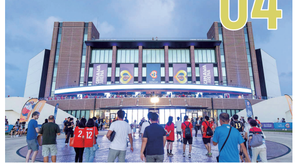
FIBAバスケットボールワールドカップでは約12万5千人もの観客を動員