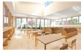
新しい児童館の図書学習室イメージ