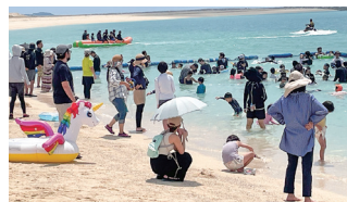
親子連れで賑わう「潮乃森ビーチフェスタ」

また、潮乃森の外周を緑地で囲み、野鳥園を配置するなど環境に配慮しており、沖繩独特の空気感の中で文化や海にふれ、心身ともにリフレッシュし楽しんでいただける空間づくりを目指しています。