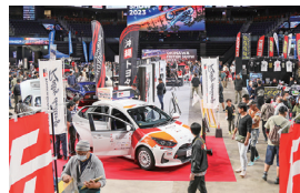
沖繩モーターショー2023

滞在型観光の推進及び雇用創出を目的に「(仮称)沖繩サーキット」の整備実現に向けて取り組んでいます。モータースポーツに対する市民の認知度向上や、サーキット整備への機運醸成を目的に「モータースポーツ振興イベント」を毎年開催。令和3年には「モータースポーツマルチフィールド沖繩」の供用を開始し、施設の運用を通じて県内モータースポーツの聖地化を目指しています。