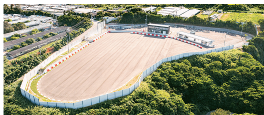
モータースポーツマルチフィールド沖繩