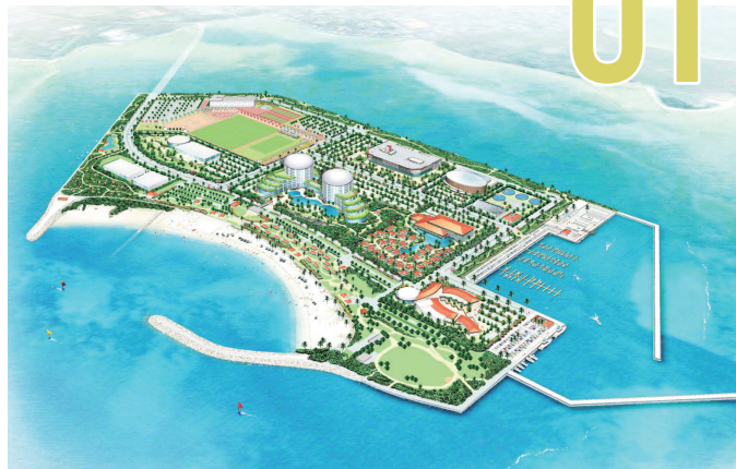
潮乃森の完成イメージ図