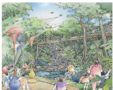
拡張区域のイメージパース②