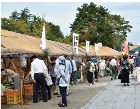
▲手作りの品が並ぶ無人販売の「棒杭市」