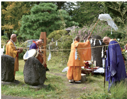
▲草木に宿る命を供養するために建てた碑で行う草木塔祭