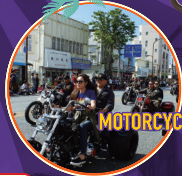
MOTORCYCLE PARADE バイクパレード