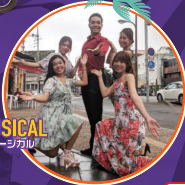
STREET MUSICAL ストリートミュージカル