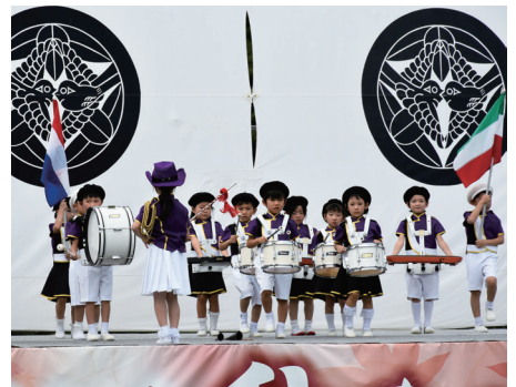
▲ステージイベントの一つ保育園児のマーチング