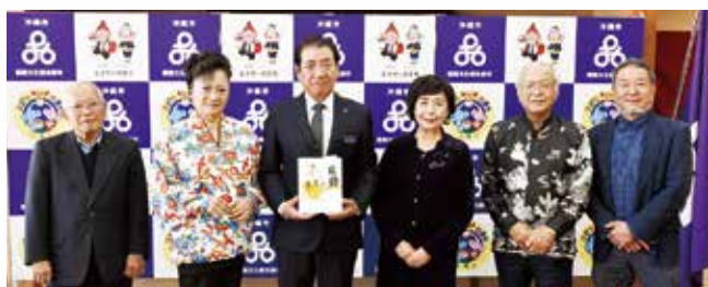
2/20 沖縄市文化協会 歌謡部