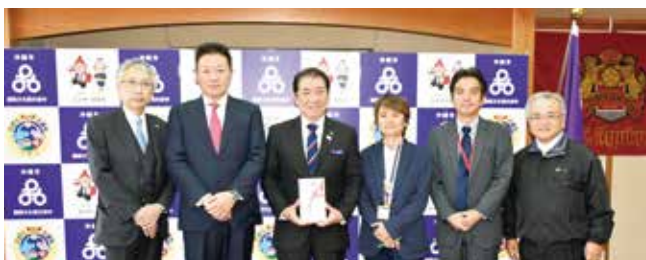
1/23 株式会社リボルブ・シス、株式会社リボルブ沖縄