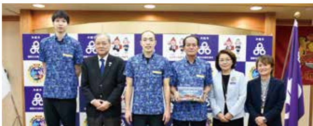
1/20 パナソニック パンサーズ