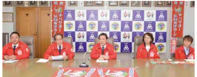
12/10 広島東洋カープ(桑江市長より報告会見)