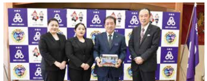
12/26 オキナワグランメールリゾート