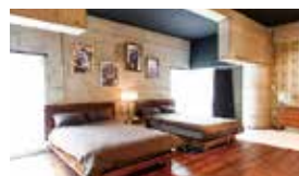
1室4名まで宿泊可能