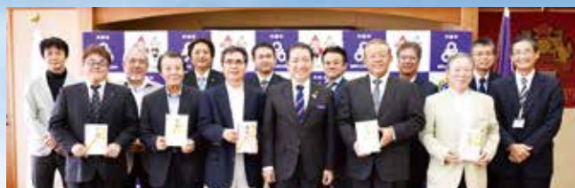
1/23 沖縄市建設業者会、沖縄市管工事協同組合、 沖縄市土木コンサル会、沖縄市建築士事務所会、沖縄市電業会