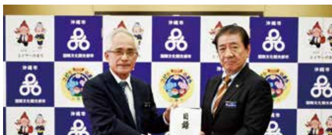
3/10 沖縄市観光物産振興協会