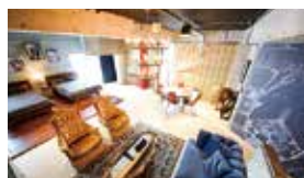
客室名/ロックサイド