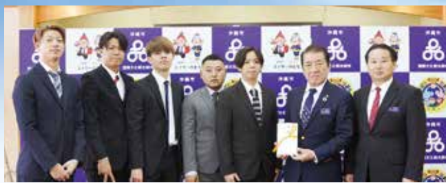
2/6 沖縄市成人式新成人実行委員、豊中市成人式企画委員会