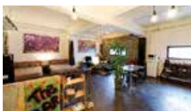
客室名/ルーフトップスター