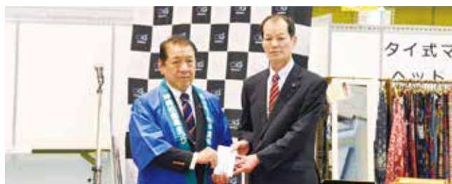
1/25 長野県阿智村 阿智ちむわざの会