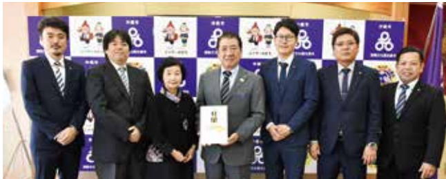
1/16 沖縄市まちづくり研究会及び関係団体

火災で焼失した首里城の早期復興を願い、沖縄市首里城復旧・復興支援募金活動事務局にも多くの寄付金が寄せられました。寄付金贈呈式に訪れた皆さんをご紹介します。