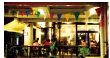
トリップショットホテルズ・コザ

客室の場所や雰囲気等の詳細はHPで! ユーチューブの「街改造チャンネル」では、客室やコザのまちを動画で紹介しています!