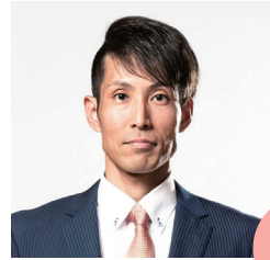
出身地：沖縄県沖縄市