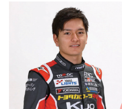
出身地：沖縄県沖縄市

僕が育った大好きな沖縄市をPRできる大役を任せて頂くこととなり、大変嬉しく感じる反面、身の引き締まる思いです。「沖縄市から全日本、そして世界へ」をコンセプトに、モータースポーツマルチフィールド沖縄を拠点としたレース活動を通して沖縄市の良さを存分にPRしていきます!