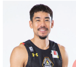
出身地：沖縄県沖縄市

沖縄市で育った人間として、再び輝く街として注目されることを願っています。そのためにも沖縄市出身の私も、ちゃんぷる～沖縄市大使として、宣伝活動に力を入れていきます。どうしたら魅力ある街として君臨することができるのかも考えていきたいと思っています。