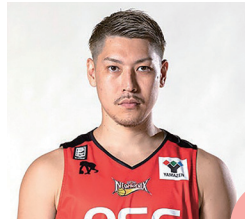
出身地：沖縄県沖縄市

小さな頃から慣れ親しんだ町である沖縄市は、コザ・ミュージックタウンや沖縄こどもの国など、様々な娯楽施設もありながら、泡瀬の綺麗な海などの自然が残る、魅力溢れる町です。しかし、なんといっても沖縄市といえば、コザです!人情溢れる商店街があり、そこには沖縄市のディープな魅力が詰まっています。ぜひコザに遊びに来て下さい!