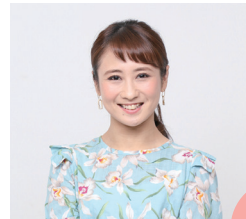
出身地：沖縄県沖縄市

生まれてから25年間、沖縄市民として暮らし、今は遠い外国、台湾にて生計を立てております。沖縄市のもつチャンプルー文化、国際都市のアイデンティティは、私の魂の中に根強く浸透しております。今後ちゃんぷる～沖縄市大使として、沖縄市と台湾の親善並びに文化、経済の交流推進にお役に立てるかと思います。