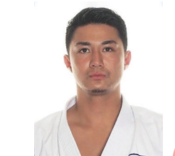
出身地：沖縄県沖縄市

かつてアメリカとここまで共存し繁栄した街があったらどうか!出身地である沖縄そしてコザの街は、今の自分にとってなくてはならない大事な宝です!ここにしかない独特の雰囲気は是非その目と心で感じて下さい!