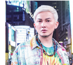
出身地：沖縄県沖縄市

私は、これまで家族、友人、地域や周りの人々に支えられ日々過ごしてまいりました。大使になったことで、地元沖縄市やこれまで私を支えてくれた方々に何かしらの貢献ができる、大変良い機会が得られたと感じております。まだまだ鍛錬の日々は続きますが、ちゃんぷる～沖縄市大使の名に恥じぬよう、これからも精進してまいりたいと思います。