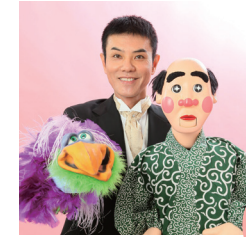
出身地：沖縄県沖縄市