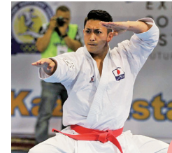
出身地：沖縄県沖縄市

アメリカと闘いアメリカを取り入れ、独自の文化を育てたコザ。日本でも沖縄でもない異彩を放つ街。伝統文化からニューウェーブまで味わえる芸能の宝庫、沖縄市へどうぞ!