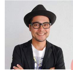
出身地：沖縄県沖縄市

私は生まれも育ちも沖縄市で、ここまで自分を築き上げてこられたのも沖縄市の素晴らしい環境があってこそだと思っています。沖縄市の魅力はスポーツやエイサーなど色々な分野で市民、県民に勇気や元気を与えているところではないでしょうか。未来ある子ども達がスポーツの魅力を感じ、市民や県民に勇気や元気を与えてくれることを願っています。