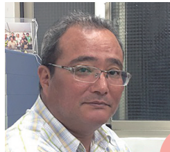
出身地：沖縄県沖縄市

沖縄本島の真ん中であって音楽を愛する人がとくに多い町、沖縄市。僕が毎年楽しみにしているのが、全島エイサーまつり!興奮と感動が詰まった最高の祭りです!