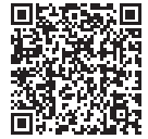
▲市公式ホームページ

申込書等配布 新規申込の方:保育・幼稚園課窓口にて配布 在園中の児童がいる方:在園中の市内認可保育施設および市立幼稚園 ※新規申込のきょうだい児についても、在園児のいる施設で受付となります。 ※9月中旬より配布予定。申請書、必要書類は市公式ホームページからもダウンロード可能です。 ※申し込み要件、対象施設等詳しくは、市公式ホームページをご確認ください。