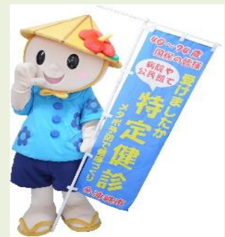
健康づくりキャラクター おきはくん