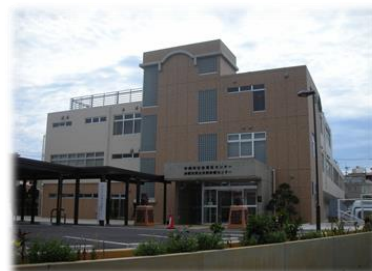
新たに整備された社会福祉センター・ 男女共同参画センター