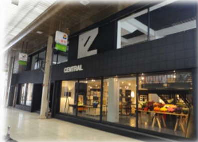
リノベーション事業により 新たにできた商業テナント