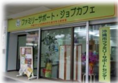
空き店舗のリノベーションにより 設置された就労等支援施設