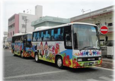
中心市街地の主要施設を結ぶ 中心市街地循環バス