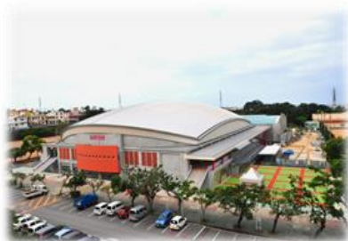
建て替えられた体育館