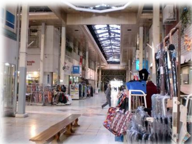
アーケードの改修により 明るさを取り戻した商店街