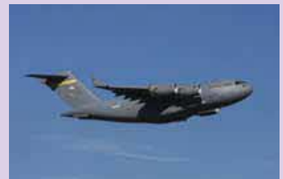
C-17 グローブマスター