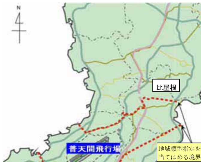
（普天間飛行場の航空機騒音を計測している1ヶ所）