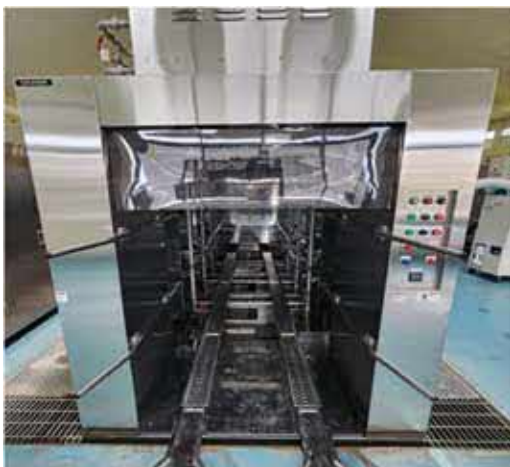
写真：システムコンテナ洗浄機 一式