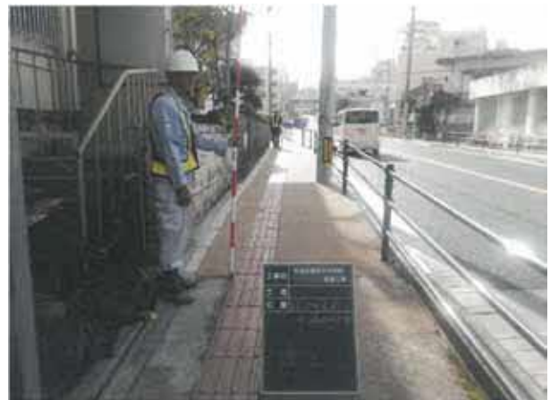
写真：市道安慶田中学校線（歩道）