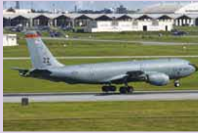
KC-135 ストラトタンカー