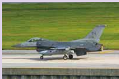
F-16 ファイティングファルコン