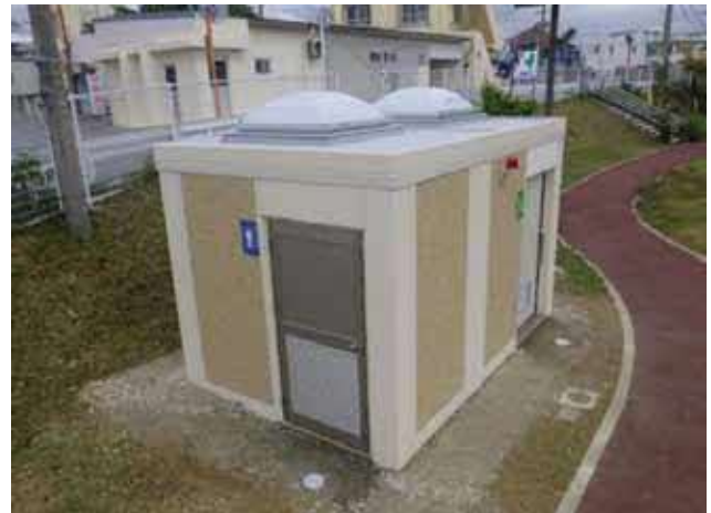
写真：トイレ整備後