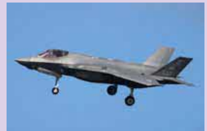
F-35 ライトニング II