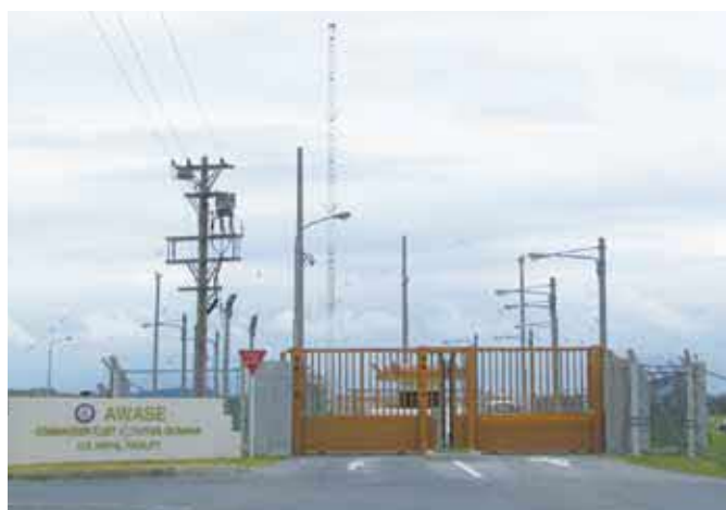
在沖米海軍艦隊活動司令部提供