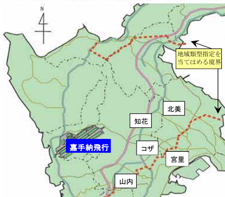
（嘉手納飛行場の航空機騒音を計測している5ヶ所）