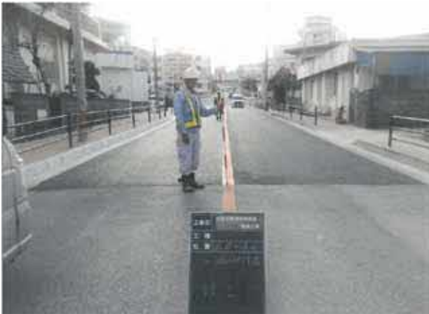
写真：市道安慶田中学校線（車道）