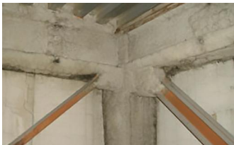
吹付け材(※)の例(梁・柱)