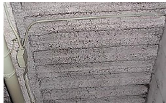
吹付け材(※)の例(床・天井)

※全ての吹付け材がアスベストを含む訳ではありません。判定には分析調査が必要です。