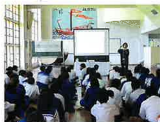
▲安慶田中学校の様子