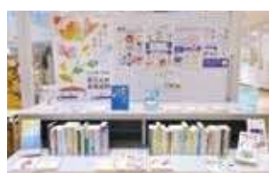
市役所 市民ホール

ター病院ロビー、沖縄市立図書館にて、パネル展や関連図書の紹介を行う賛同企画展を開催しました。