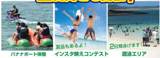
バナナボート体験 インスタ映えコンテスト 遊泳エリア