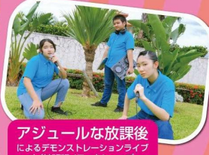
アジュールな放課後 によるデモンストレーションライブ と参加型DJワークショップ