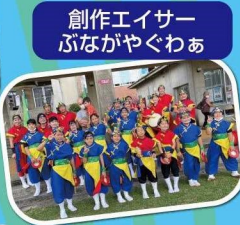
創作エイサー ぶながやぐわあ