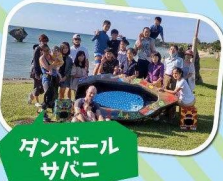
ガンボール サバニ