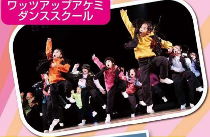
ワツアップアカデミ ダンススクール