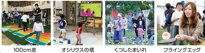
100cm走 オシロウスの塔 くつしたまいれ フライングエッグ

YURU SPORTS 世界ゆるスポーツ協会 WORLD YURU SPORTS ASSOCIATION