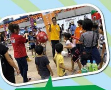
中国・メキシコ・ペルー等世界の遊びで 楽しもう!