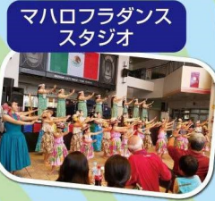
マハロフラダンス スタジオ