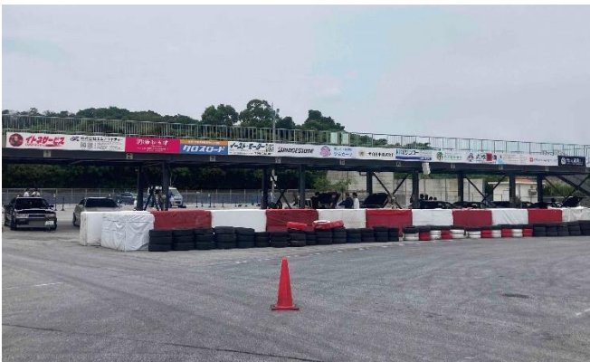
<パドック棟 (駐車場側) >