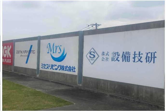
<看板 (中サイズ) >