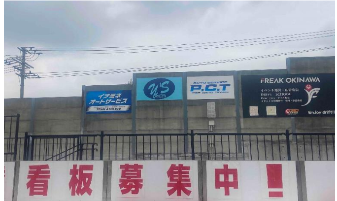
<看板 (小サイズ) >