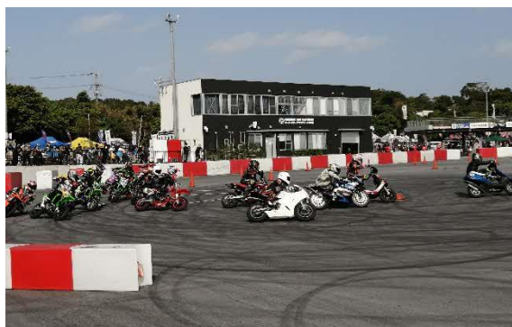
モータースポーツ競技開催時の様子

本施設は、モータースポーツ利用だけでなく、交通安全の普及啓発や地域イベントなど、様々な用途で活用されております。