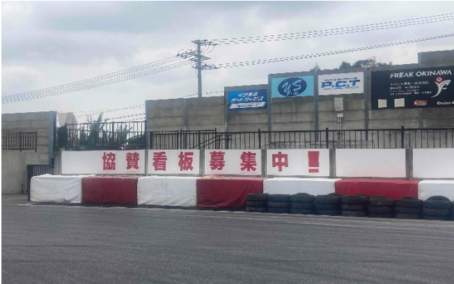
<看板 (観覧席) 新設 >