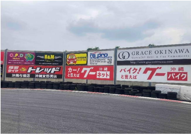
<看板 (大サイズ) >