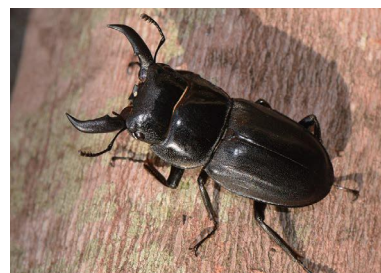
オキナワヒラタクワガタ 同じ種でも、島ごとに少しずつ違いがあります