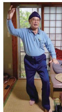
太極拳「馬のたてがみを分ける」ポーズ

「メンバー同士の仲が良いので、お互いの見守りにもつながっています。みなさんも気軽に参加してください」と笑顔を見せました。