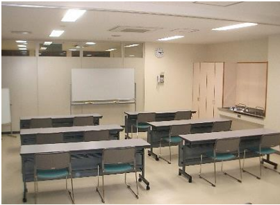
ゆい工房 収容人数：12名 ■工作講座などに利用