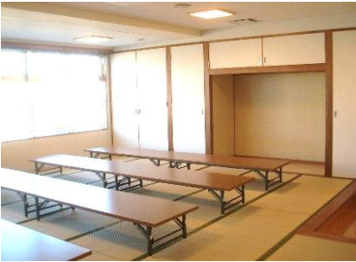
いこいの室 収容人数：15名 ■各種講座や会議などに利用