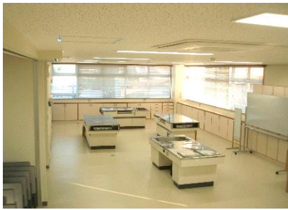
調理室 収容人数：20名 ■調理講習や栄養指導などに利用