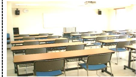
会議室 (3F) 収容人数：45名 ■各種会議及び講座などに利用 ※3階会議室については、男女共同参画センター (3F) へお問い合わせください。