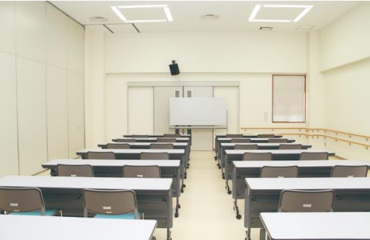
会議室 2 (2F) 収容人数：35名 ■各種会議などに利用