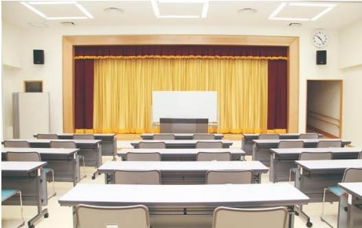
会議室 1 (2F) 収容人数：35名 ■各種会議などに利用