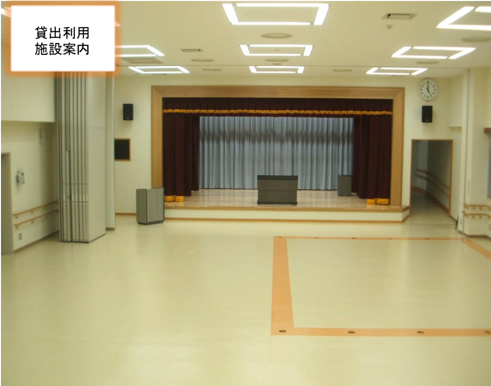
集会室 収容人数：100名 ■講演会、各種行事及び会議などに利用