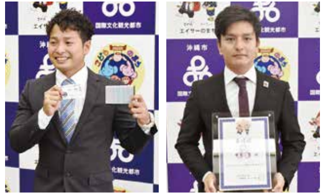
国際オートバイレーサー 仲村 優佑