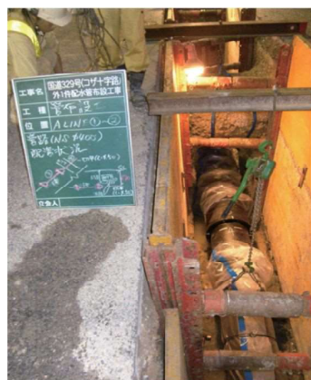
配水管布設工事 (NS形ダクタイル鋳鉄管:耐震管)