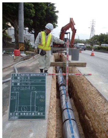
配水管布設工事 (GX形ダクタイル鋳鉄管:耐震管)