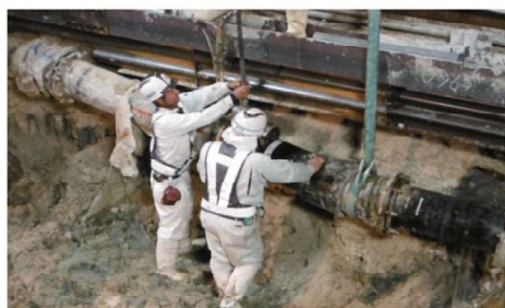
配水管布設工事に伴う既設管撤去作業

今後は、平成25年3月に策定した「沖縄市水道施設整備事業計画（管路耐震化計画・更新計画）」を基に更新事業を実施予定しておりますが、持続可能な水道事業を実現し、次世代に健全な水道を引き継ぐためには、中長期的な視点に立って、技術的な知見に基づいた施設整備・更新需要の見通しについて検討し、着実な資金計画に基づく更新投資を行う必要があります。