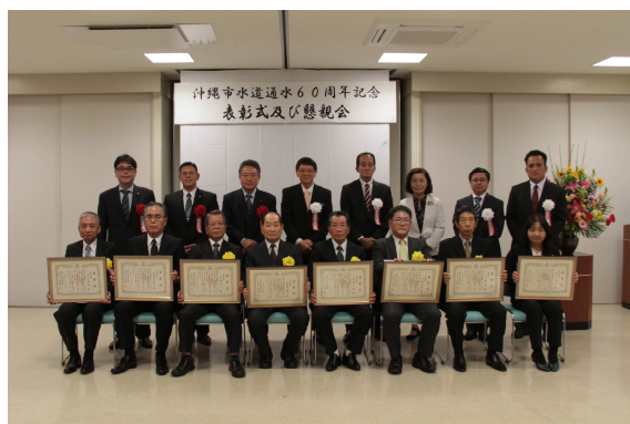
沖縄市水道通水60周年記念表彰式及び懇親会・2019年

2019年には、沖縄市が通水を開始し60年目の節目の年となり、「沖縄市水道通水60周年記念表彰式及び懇親会」を開催した。表彰式では、功労表彰者(2名)、特別表彰者(8名)、個人表彰者(1名)の計11名を表彰した。