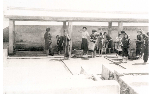
泡瀬カーヌ毛:井戸を利用する人々

上水道が布設される以前は、集落の井泉や個人所有の井戸水のほか、個人経営の簡易水道、米軍の公用共同栓に依存していた。