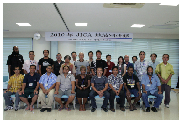
JICA地域別研修・2010年8月

伝えることを目的として、JICA地域別研修(島嶼における水資源保全管理)が開始された。