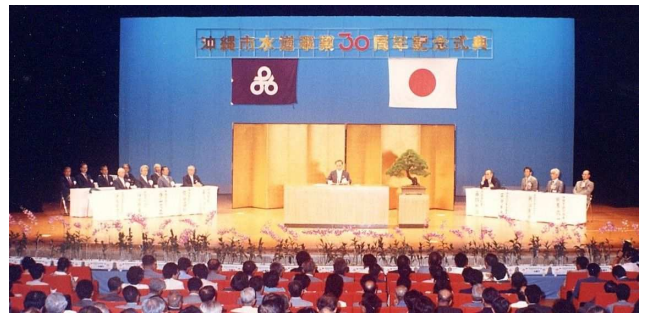
沖縄市通水30周年記念式典(沖縄市民会館)・1988年6月

1991年6月に水資源有効利用功労者表彰事業をスタート。通水35周年目の1992年4月には水道部から水道局へ移行した。1994年6月には知花・松本簡易水道が34年間の歴史を閉じ、給水普及率が100%となった。