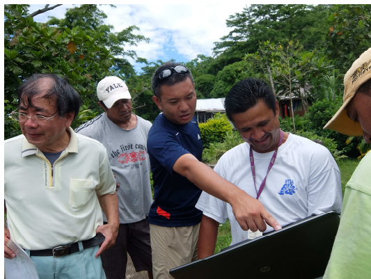
サモア独立国で指導する職員・2014年

2014年には、JICA地域別研修の参加国の1つであるサモア国、およびJICAより要請を受けCEPSO(沖縄連携によるサモア水道公社維持管理協力強化プロジェクト)を開始し、現在までに6名の職員をサモア独立国へ派遣した。