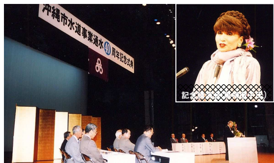
沖縄市通水40周年記念式典(沖縄市民会館)・1998年6月19日

1998年は通水40周年記念式典のほか配水池壁画の表彰、記念誌も発刊した。また、これまでの活動（水資源有効利用功労者表彰事業）が評価され沖縄タイムス賞（自治賞）を受賞した。