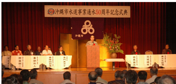
沖縄市通水50周年記念式典(NBCホール)・2008年7月4日

2008年は通水50年の節目を迎える年となり、記念式典・祝賀会を挙行了。また、需要者へ日頃の感謝を込めて、県内で活躍しているアーティストによる記念コンサートを開催し大好評を博した。