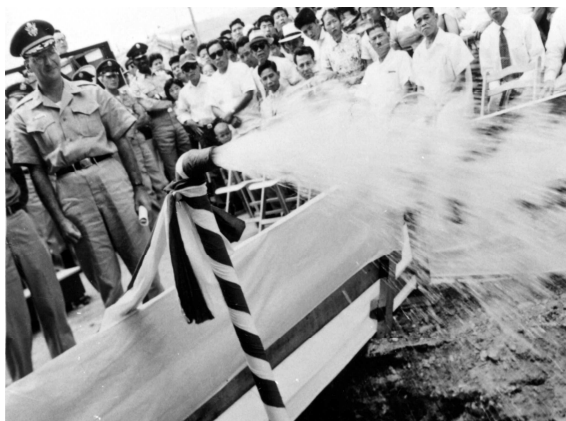
通水式・1958年(昭和33年)6月19日

(米軍送水管とコザ市配水管との接続工事が完了し、通水式が行われた。沖縄市水道通水1日目となる。通水式は、バージャー民政官の指揮のもと執り行われ、音楽隊やラジオ放送など進行は米軍主導で行われた。場所は一番街前胡屋バス停付近。)