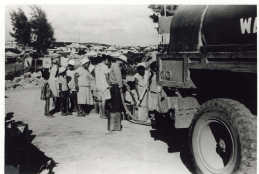
照屋地域への給水の様子(1963年)

旧コザ市では各地域への給水工事に並行して分岐点を次々に新設し、増加する水需要に対応していた。水道普及率が50%を超えた1963年5月、72年ぶりの大干ばつでは、延べ206日に及ぶ給水制限を実施し、米軍基地から市民への給水が行われた。