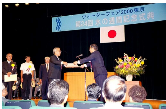
国土庁水資源功績者表彰(東京)2000年8月

2002年、沖縄市美里に新庁舎が完成し3月から業務開始。新時代に相応しい効率的な事業運営と市民サービスの提供に努めている。同年5月には約27年間続いた米軍との基地給水契約を解除し、一般市民と同様の給水事業協定を締結した。同年7月からはコンビニエンスストアでの水道料金の徴収を全国17社に拡大、また昼食時間帯の窓口業務を開始するなど市民サービスの向上に努めている。