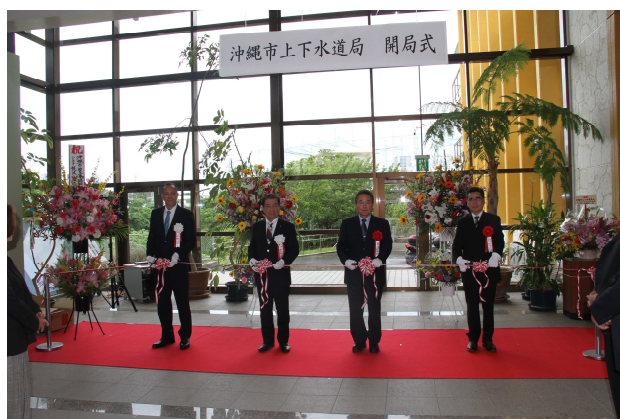
沖縄市上下水道局 開局式・2020年4月1日

2020年には、下水道課との統合に伴い、新たに「沖縄市上下水道局」に組織名称変更となった。