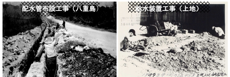
当時の水道工事の様子(1959年)

当時の給水装置工事は、手押しのリヤカーに鉛管や穿孔機を積み込んでの移動で、道路の掘削もツルハシやスコップ等を用いての作業は過酷を極めた。