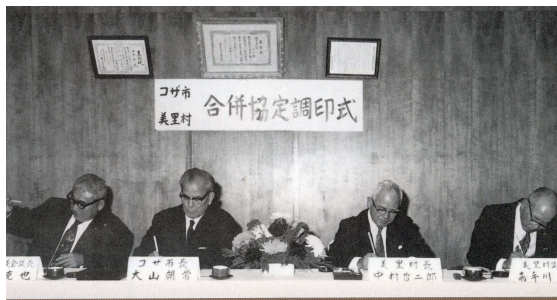
合併調印式の様子

1974年4月1日、旧コザ市と旧美里村の合併により「沖縄市」が誕生し水道事業も引き継いだ。全市的な安定供給が急がれ、配水管網の整理・統合や出水不良地域の解消などのほか簡易水道から上水道への移管も積極的に行った。嘉手納基地への給水問題も1975年7月に解決した。