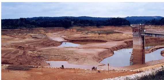
長期渇水で干上がった瑞慶山ダム(現倉敷ダム)

1981年の長期渇水は“326日の給水制限”となり、多方面に大きな混乱を起こした。こうした問題の解決に配水池（本市初の配水池が1983年完成）やポンプ場施設等の整備を行い、並行して分岐点の統廃合なども行った。また、維持管理業務に、1979年からは専従調査員を配置して漏水防止作業の強化を図ってきた。