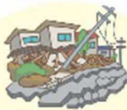
Sismos y Tsunami

Quando se acerque un tifón fuerte, refuerce la casa, ordene los alrededores y prepárese para cortes de luz y agua para reducir daños.