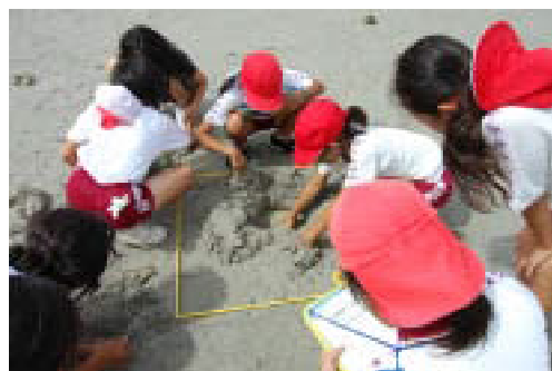
砂州での観察の様子