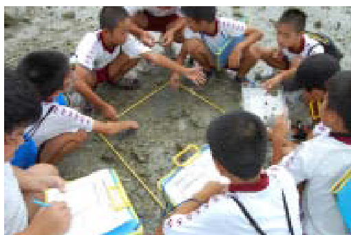
転石帯での観察の様子

各グループ(1グループ7～8名程度)に別れ、転石帯、砂州、藻場等で観察、記録を行う。