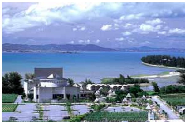
佐敷町シュガーホール