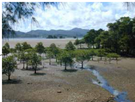
屋我地干潟の様子