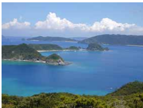
座間味島高台から見える景色