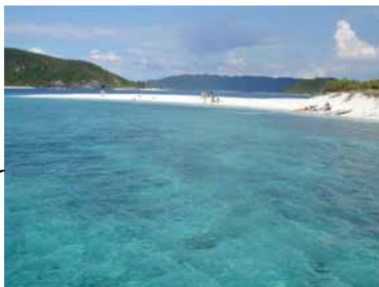
ボートから見える安室島と嘉比島ビーチ