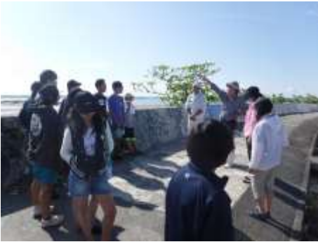
オキナワハクセンシオマネキ がいっぱい!