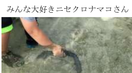
みんな大好きニセクロナマコさん