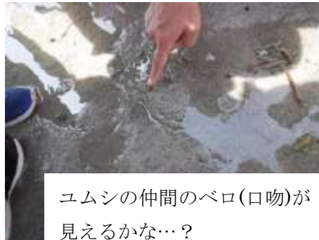
ユムシの仲間のベロ(口吻)が見えるかな…？