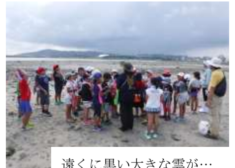
遠くに黒い大きな雲が…