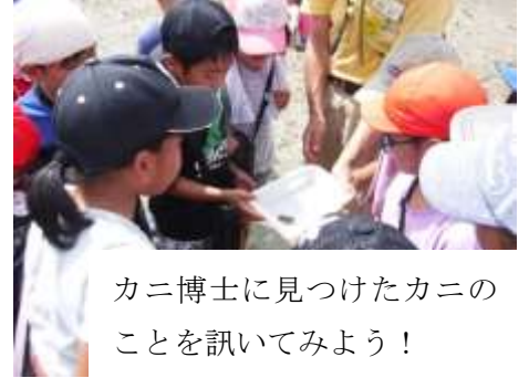
カニ博士に見つけたカニのことを訊いてみよう！