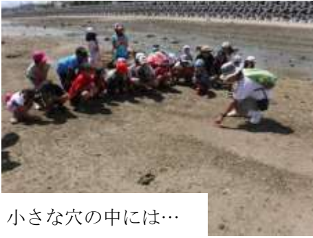
小さな穴の中には…