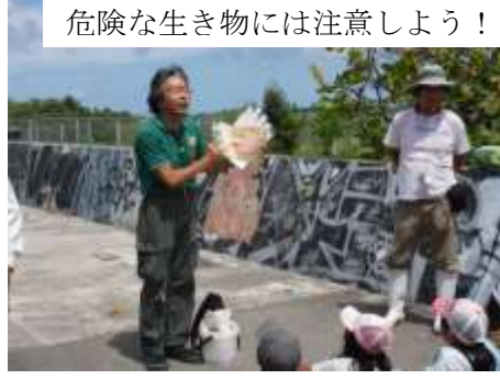
危険な生き物には注意しよう！