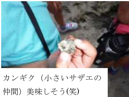
カンギク (小さいサザエの仲間) 美味しそう(笑)