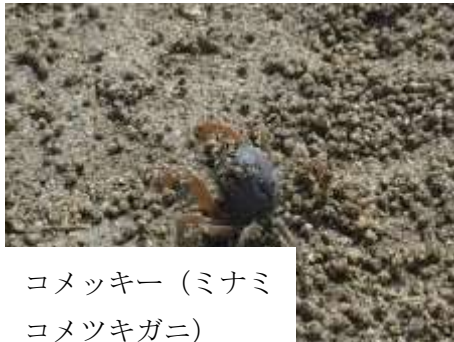
コメツキー (ミナミコメツキガニ)