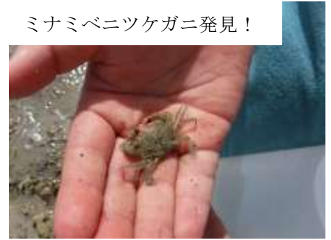
ミナミベニツケガニ発見！