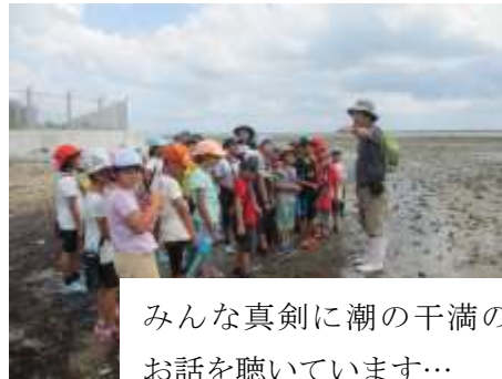
みんな真剣に潮の干満のお話を聴いています…