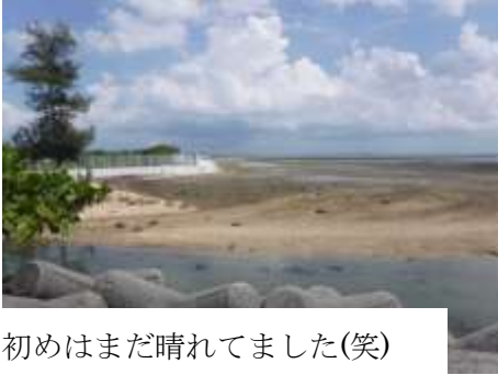
初めはまだ晴れてました(笑)