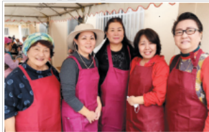
▲美さと児童園もちつき大会ボランティア