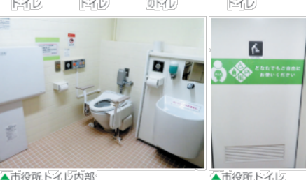
▲市役所トイレ内部 ▲市役所トイレ