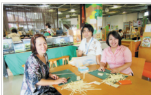
▲こどもの国ボランティア

今年度は「柔軟な発想と行動力で共に輝き未来を創る 女性会」をスローガンに掲げ、沖縄市こどものまち宣言10周年の節目の年であるため、こどもに寄り添う社会の実現に向けたチャリティートークショーを開催し、収益金全額を美さと児童園や沖縄市社会福祉協議会に寄付しております。今後とも地域社会に貢献できる女性会をめざし、活動していきます。