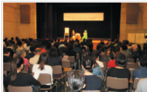
▲沖縄商工会議所女性会チャリティートークライブ