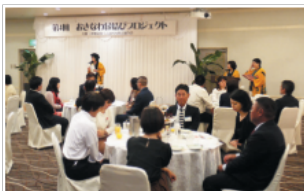
▲沖縄県商工会議所女性会連合会婚活パーティー