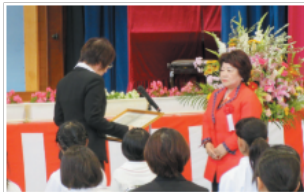
▲美さと児童園感謝状贈呈