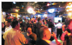
▲さよなら平成ダンスパーティー