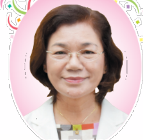
與那嶺克枝 副市長

沖縄市の副市長として、7月9日付けで與那嶺克枝副市長が就任しました。本市では、女性の副市長は初登用で、任期は2022年7月8日までの4年間。