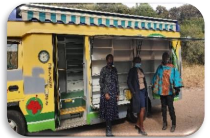
Freedom Parkの職員と2代目「ちえぞう君」

昨年、移動図書館「ちえぞう君」は3代目に代わり、2代目「ちえぞう君」は、南アフリカのFreedom Parkへ寄贈されました。南アフリカの成り立ちや歴史を展示している記念公園・博物館FreedomParkは、小学校から大学を対象として出張授業で訪問しています。 (SAPESE-JAPANのホームページより)