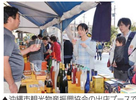
▲沖縄市観光物産振興協会の出店ブースで泡盛を試飲