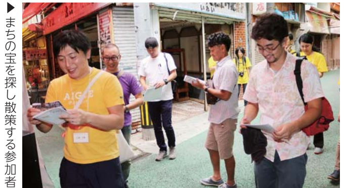
▶まちの宝を探し散策する参加者