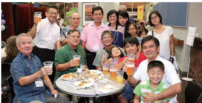
▲久しぶりの再会に笑顔があふれる