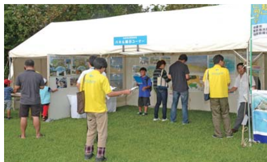
▲東部海浜開発の紹介も行われた