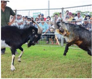
▲迫力あるひーじゃーオーラセー