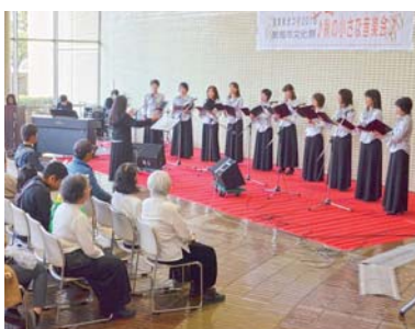
▲美声が披露された秋の音楽会