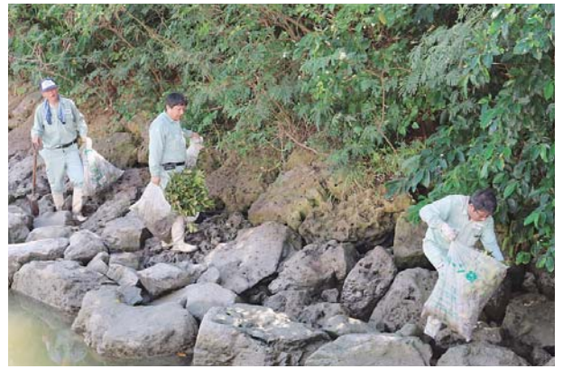
▶ 比屋根湿地の岩場を清掃する参加者