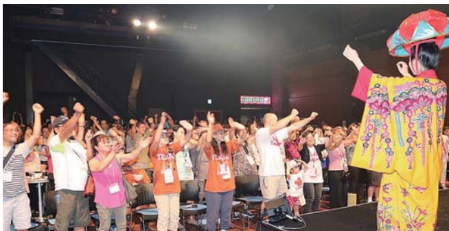
▲ウチナーンチュはやっばりカチャーシー

と歓迎し、親族や知人、友人との再会や世界各地に住むウチナーンチュが親睦を深めた。会場では沖縄の歴史の演劇や古典音楽が披露されたほか、市で沖縄の文化を学んでいる海外移住者子弟研修生の意見発表などが行われた。また、民謡ライブも行われ、来場者が飛び入りで参加する場面もあり盛り上がりを見せた。レセプションの最後には、「また、5年後にお会いしましょう」を合い言葉に会場が一体となってカチャーシーを踊った。