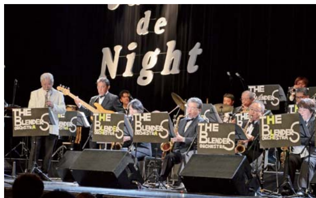
▶ビッグバンドの迫力ある生演奏

コンサートは、音楽によるまちづくりの推進を旨とし、活力あふれる元気な沖縄市にする取り組みで、市内の児童で構成されたOkinawa Jazz Academy for Students Memberや、県内を代表する The Blendes Orchestra、KAZAONIONSなどのジャズバンド6団体が出演し、「情熱大陸」のメインテーマ曲や「見上げてごらん夜の星を」「高校三年生」などの曲をジャズにアレンジして演奏した。訪れた多くの観客は、県内トップレベルのジャズの生演奏を間近で楽しんだ。