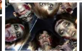
ホラーナイト ゾンビストリート