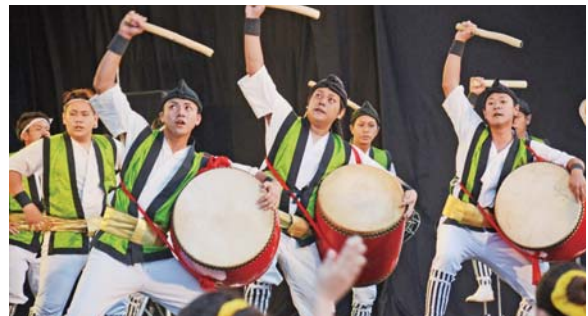
▲中の町青年会のエイサー演舞