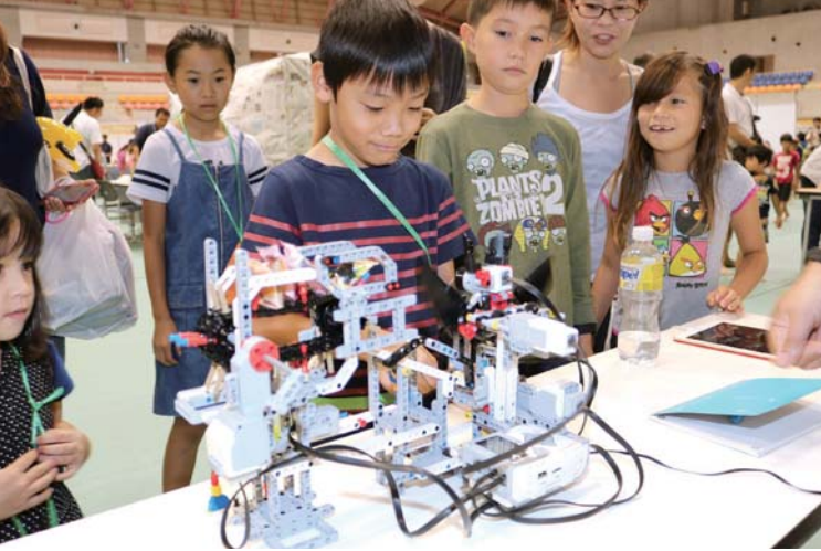
▲ロボット体験で目を輝かせる子ども達

「ホンモノへのふれあいと、体験が科学の扉をひらく」をテーマに「沖縄市サイエンスフェスタ2016」(市教育委員会・公益財団法人沖縄こども国主催)が市体育館で開催された。