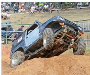
▲急斜面を走破する四駆トライアル