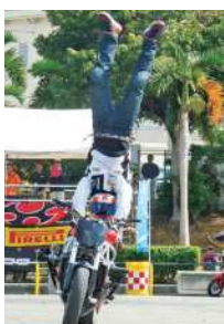
▲バイクの上で逆立ち!(エクストリームバイク)