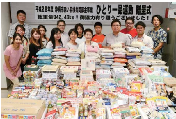
▲多くの善意が寄せられた

贈呈されたのは、市社会福祉協議会が取り組んでいる「ひとり一品運動」で集められた食料で、市内の自治会も協力してお中元の「おすそわけ」を広く呼びかけたところ、市民や団体、企業から提供があった。今回、寄せられた食料は942.46kgで過去最高。市社会福祉協議会では食料に困っている人を支援するため、平成21年から同運動を行っている。