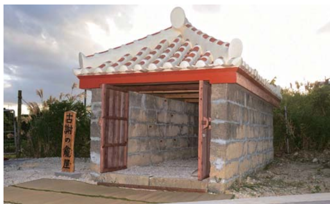
▲復元された古謝の竈屋

古謝の竈屋の復元工事が10月16日に完了した。竈とは遺体を墓地まで運ぶための輿で、火葬の普及に伴い減っていき、現在では貴重なものとなっている。竈屋は竈を納める建物で、戦前のものに残っているのは市内では古謝のみ。古謝の竈屋は昭和初期に建造され、近年では劣化が進み、平成25年に台風10号の暴風で崩壊した。古謝では今年の8月に復元委員会が設立され、自治会員や企業、団体からの寄付金で竈屋を復元した。復元の際は壊れたものを修復し、代えが必要な部分は当時と同じ資材を使った。