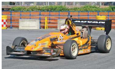
▲ジムカーナには一般車からレーシングカーまで様々な車が登場