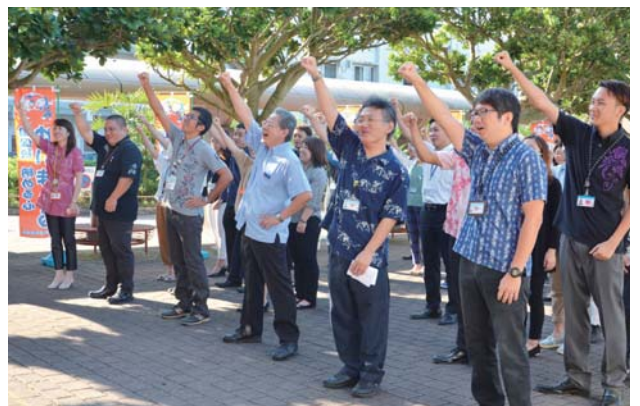
▶ 各課連携し、職員一丸となって取組む