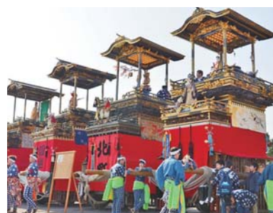
▲重さ5トンもある尾張横須賀まつりの山車