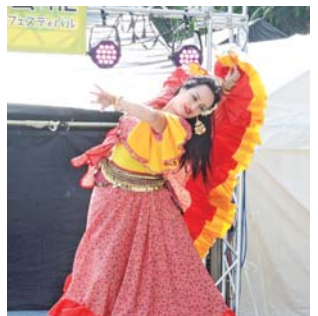
▲ロシアのジプシーダンス