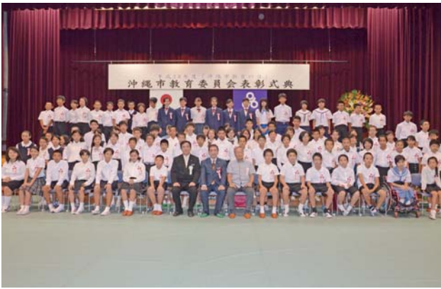
▶ 受賞した児童生徒たち