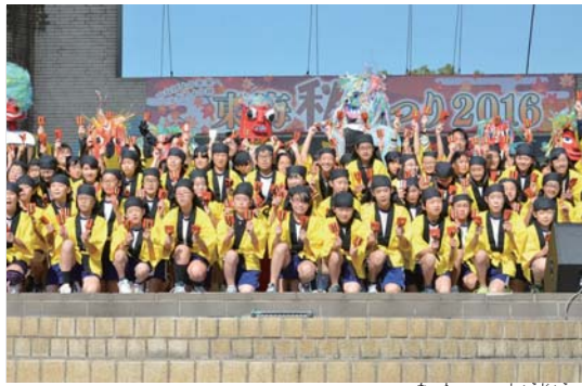
▲東海市名和小学校5,6年生による名和つ子 なわ 猩猩 しょうじょう