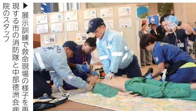
▶展示訓練で救命現場の様子を再現する市の消防隊と中部徳洲会病院のスタッフ