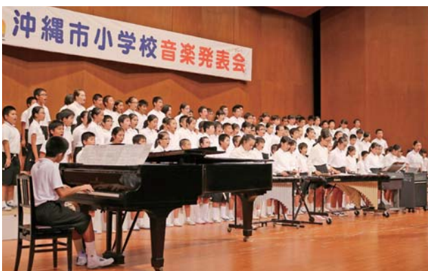
▶ 比屋根小6年の合唱奏「海のかなたへ」