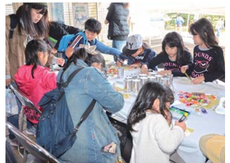
▲スチール缶を利用したオリジナル貯金箱作り