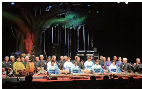
▲幕開けは沖縄市芸能団体協議会の古典芸能