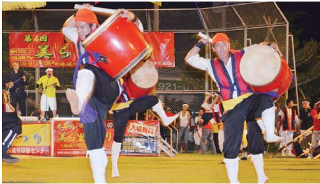
▲松本青年会による勇壮なエイサー演舞