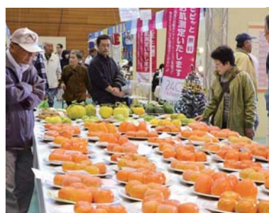
▲品評会受賞作品の数々