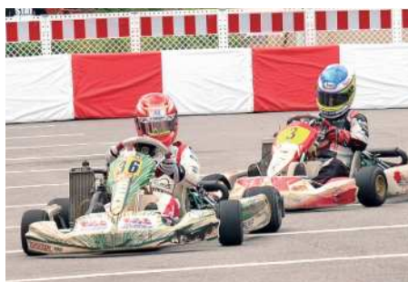
▲急カーブを駆け抜けるレーシングカート