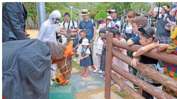
▲与那国馬にエサをプレゼント