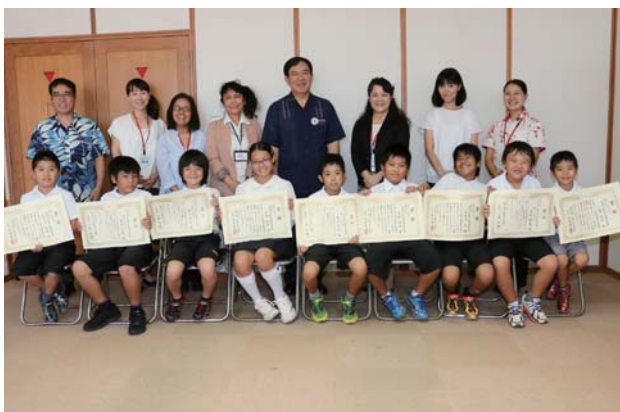
▲賞状を手に笑顔を見せる児童

同機構は、障がい者雇用への理解と関心を深めるため、障がい者の描いた絵画や働く姿の写真を募集し、9月の障害者雇用支援月間のポスターの原画にしている。安慶田小ではキャリア教育の一環として、昨年に応募しており、2年連続で5人が理事長奨励賞を受賞している。10月21日には児童らが狩俣教育長を訪ね、受賞の報告をした。