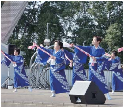
▲息の合った文化協会会員の演舞