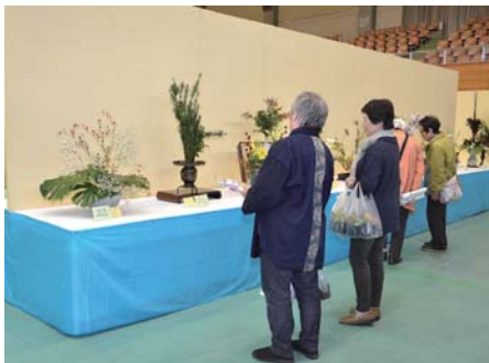
▲生け花作品を観賞