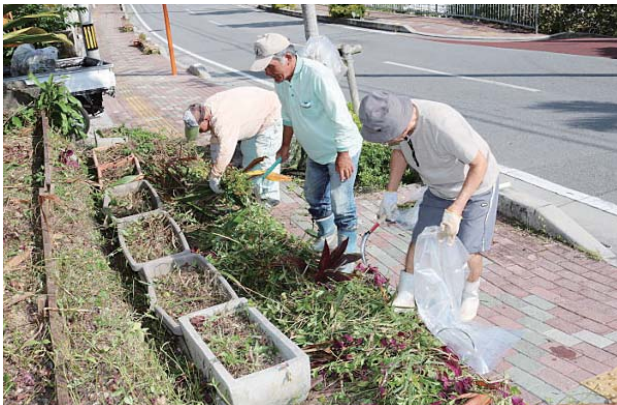
▶ 草木を刈る参加者

回収されたごみは、可燃ごみ2590kg、不燃ごみ403kg、かん285kg、びん210kg、ペットボトル25kg。