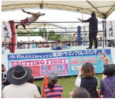
▲間近で見るプロレスに大興奮

第4回美ら里まつり（同実行委員会主催）が、10月22日と23日の2日間、農民研修センターで行われた。同まつりは、美里・美原・北美小学校と美里中学校のPTCA（PTAに地域を加えた組織）、北部地区6自治会（美里・松本・知花・登川・池原・明道）が連携して開催している地域住民参加型のまつりで、