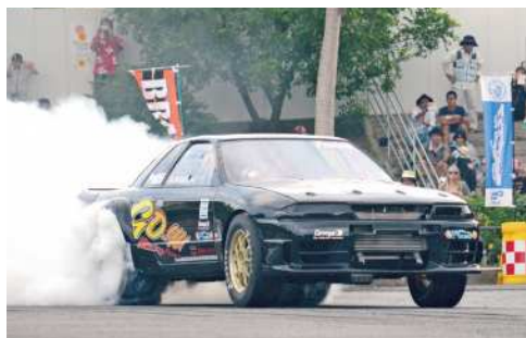
▲タイヤスモークをあげスタート(ドラッグレース)