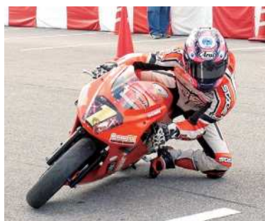
▲会場を盛り上げるミニバイクのレース