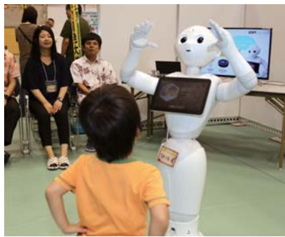
▲ロボットのペッパー君と会話を楽しむ来場者

プログラミングなどの体験、万華鏡、ミツロウキャンドル、モーターなどの物づくり体験など、様々なブースを出展した。また、山内中の科学部と美東中のサイエンス部による実験ショーも行われ、会場には多くの親子連れが訪れ、科学の楽しさや不思議さを体験した。 催しは子どもたちが科学とふれあう場をつくることで科学の楽しさを知ってもらうと初開催された。