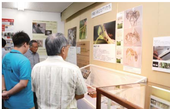
▶企画展では5年間の調査結果が展示されている

リバチ「クボミツヤアリバチ」や多数の絶滅危惧種が発見されており、市には多くの貴重な生物が存在していることが分かった。10月31日にはオープニングセレモニーが開かれ、絶滅危惧種を発見した調査結果や、外来生物の危険性、市の自然の現状などを博物館の職員が説明した。企画展は12月25日まで。開館時間は午前9時から午後5時まで。月曜日と祝日は休館。