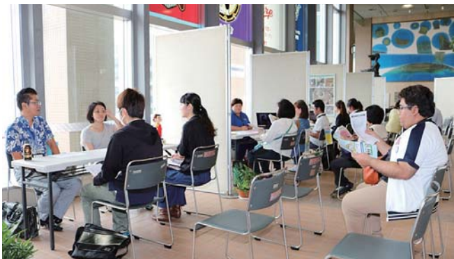
▲企業の説明に聞き入る参加者

説明会は就職を希望する市民の支援と人材を求める企業とのマッチングを目的に開催されたもので、介護、福祉、コールセンター、保育士、幼稚園教諭、事務系、技術系などの業種の8企業と米軍従業員の説明ブースが設置された。説明会には10代から60代の幅広い年齢の求職者58人が訪れ、和やかな雰囲気の中、企業の担当者と面談し、会社概要や業務内容、雇用条件などについて熱心に話しを聞いた。