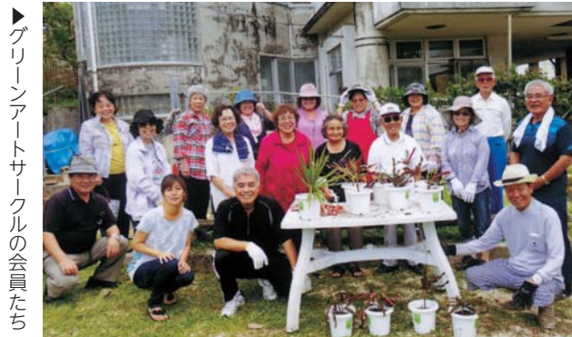
▶グリーンアートサークルの会員たち

城前自治会(新里賢一会長)の区域は周辺に小中学校や、公園、農連市場、スーパーなどが立ち並び、利便性の高い地域となっている。世帯数は500戸と市内では比較的小さめな自治会だが、住民同士のつながりが強く、夏祭りや餅つき大会、フラダンス教室、三線練習、夏休みのラジオ体操などに、地域の子ども達や住民たちが集う。また、今年の敬老会には80歳以上の高齢者約100