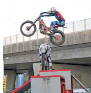
▲バイクを自在に操る二輪トライアル