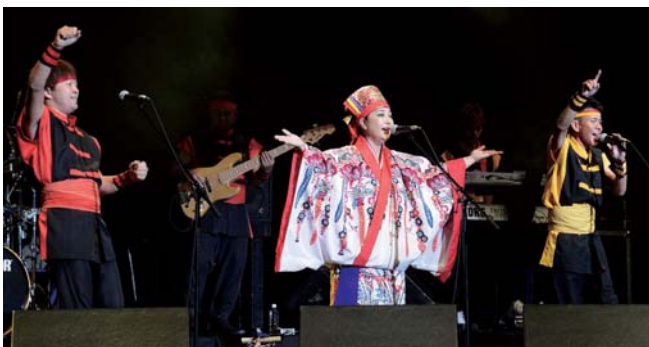
▲沖縄の伝統を受け継ぎながら新しい音楽を生み出す、りんけんバンド

し、民謡や伝統芸能、琉球古典 音楽、沖縄ポップ、エイサーな ど、多彩な演目で観客を楽し ませた。催しの最後には出演者 と観客が「ていんさぐぬ花」を 合唱し、カチャーシーを踊って 盛り上がった。