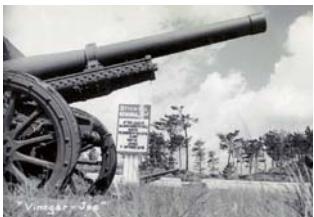
スティールウェル記念公園(現「平和の園」) 【1953(昭和28)年ごろ、越来村森根】 市史編集担当 / TEL: 929-4128 ヒストリート、ヒストリートⅡ / TEL: 929-2922