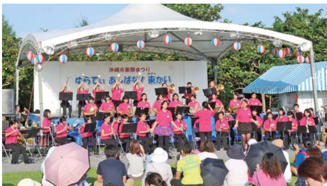
▲美東中学校吹奏楽部による演奏

ネルの展示や、ダンス、大道芸などのステージも催された。また、防災フェスタも開催され、市や県、NPO法人などが防災に関するパネルや備品などを展示した。そのほかにも、自衛隊自炊車両によるカレーの炊き出しが行われ、行列ができる盛況ぶりだった。30日には東部海浜大花火も行われ、迫力のある色鮮やかな花火が次々と打ち揚げられた。