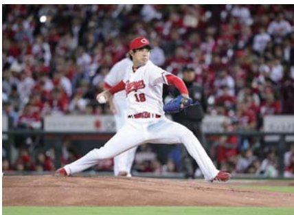
▲今季16勝とリーグ最多勝の野村祐輔投手