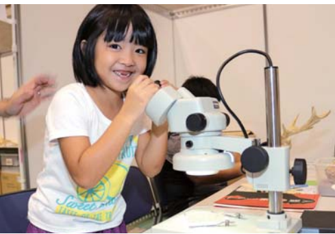
▲砂に埋もれたプランクトンを探し出せ

「ホンモノへのふれあいと、体験が科学の扉をひらく」をテーマに「沖縄市サイエンスフェスタ2016」(市教育委員会・公益財団法人沖縄こども国主催)が市体育館で開催された。