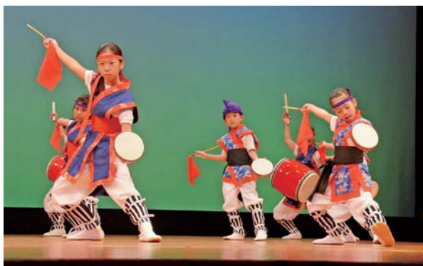
▶海邦町創作エイサー子ども育成会の演舞