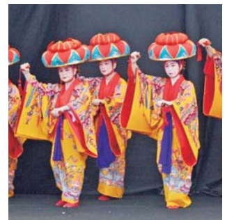
▲次々と伝統芸能を披露する市芸能団協議会