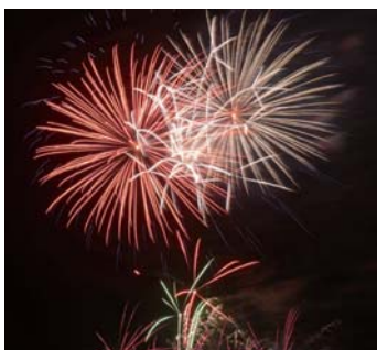
▲夜空を彩る大花火