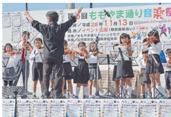
▲市ジュニアオーケストラの演奏

まつりは音楽を通して地域住民の親睦と結束を強めることを目的に行われており、会場を訪れた観客は友好を深めながら様々な音楽を楽しんだ。