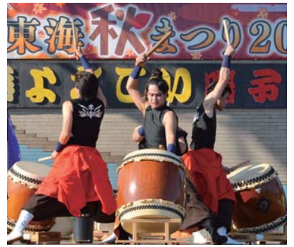
▲雄々しい東海市和太鼓連絡会の演舞