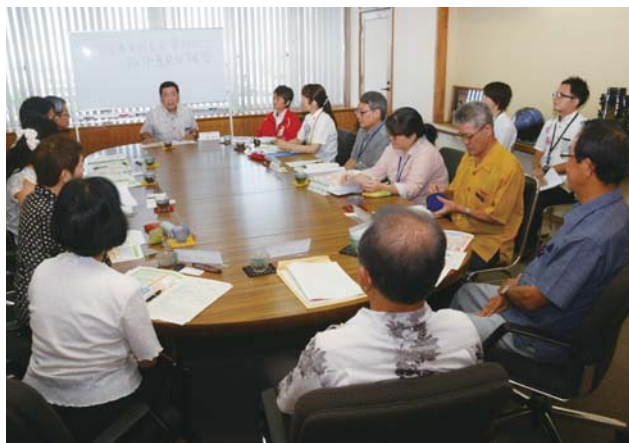
▲課題や問題点などを話し合う出席者

民生委員の職務は、住民の生活状況を把握し、相談に乗ったり、助言や援助などを行うことで、市の定員は200人だが、8月1日現在の人数は175人となっている。