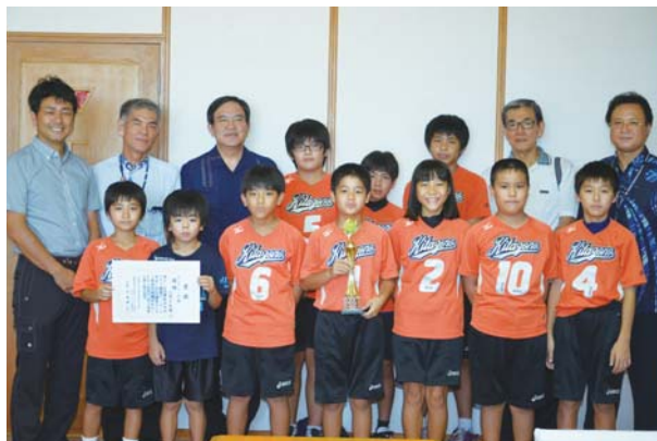
▲九州トップに輝いた北園学園の選手たちと関係者

今大会には九州各県から22チームが参加するなか、北園学園は見事優勝を果たし、来春には全国大会に出場する。狩俣教育長は「九州トップとなることは非常に価値のあるもの。チームワークの良さを活かしてさらに活躍して欲しい」と話した。