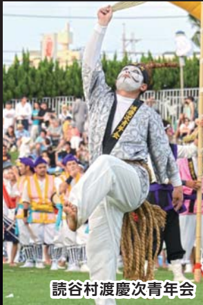
読谷村渡慶次青年会

初日は国道330号やゲート通りで道じゅねーが行われ、沿道には大勢の観客が集まった。中日はコザ運動公園で第38回沖縄市青年まつりが開催され、市内の青年会を中心にエイサー演舞が披露された。最終日は県内各地から14団体が出演し、力いっぱいエイサーを演舞した。会場には3日間で32万5千人が訪れ、各団体の特色あるエイサー演舞を楽しんだ。