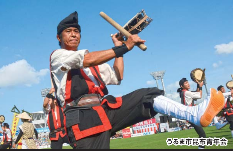
うるま市昆布青年会

響き渡る三線と太鼓、気合の乗った囃子、第61回沖縄全島エイサーまつりが8月26、27、28日の3日間、胡屋十字路周辺とコザ運動公園で開催された。