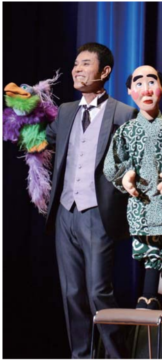
▲いっこく堂さんの腹話術ショーで会場は大盛り上がり