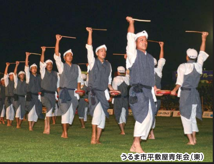
うるま市平敷屋青年会(東)