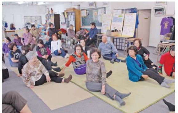
▶東自治会では健康づくりにも力を入れている

動、生涯学習支援など多岐に渡る。しかし、近年では市民のライフスタイルが多様化し、地域活動への関心が薄れ、自治会加入者が減っている。防犯や防災、環境、安全などの問題は、個人での解決は難しく、また、災害などの緊急時は迅速に対応できる地域の助け合いが必要になる。そのため、自治会を中心に住民の協力体制を整えることが重要で、各自治会では会員の増加と地域コミュニティの強化に力を入れている。 自治会長協議会は今後もより良い地域の実現に向けての活動を模索していく。