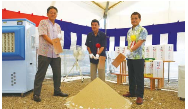
▶鉄入れの儀を行う工事関係者