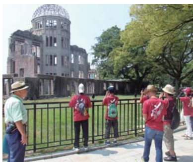
▲原爆ドームを見学する大使

研修では、市平和大使が被災地の広島と長崎を毎年交互に訪ね、戦争の悲惨さや平和の尊さを学んでいる。