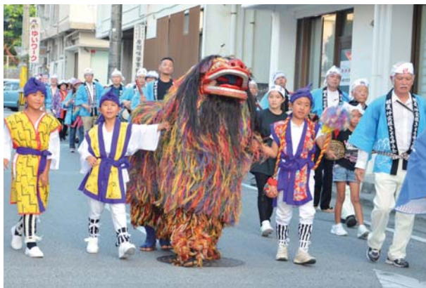
▲地域の繁栄を願い練り歩く獅子

道じゅねーで会員らが三線を弾き、ドラや太鼓を打ち響かせながら地域を練り歩き、雄々しい獅子の姿を見ようと、多くの観客が集まりにぎわった。