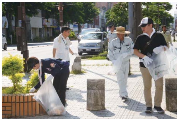
▲歩道のごみを分別しながら拾う参加者

清掃には市内協賛団体やボランティア市民、市職員など180人が参加し、市内の主な通りの歩道や街路樹周辺のごみを分別しながら拾い集めた。この日回収されたごみは、可燃ごみ200kg、不燃ごみ25kg、かん25kg、びん50kg、ペットボトル10kgの合計310kg。