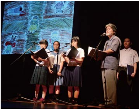
▲平和大使による朗読劇

市は、すべての人が等しく平和で豊かな生活をおくることのできるまちづくりを進めるため、沖縄戦が公式に終結した「9月7日」を沖縄市民平和の日と定めており、毎年、記念行事を実施している。また、8月1日から9月7日までを「平和月間」とし、月間に賛同した市民団体と共に平和に関する催しを開催している。