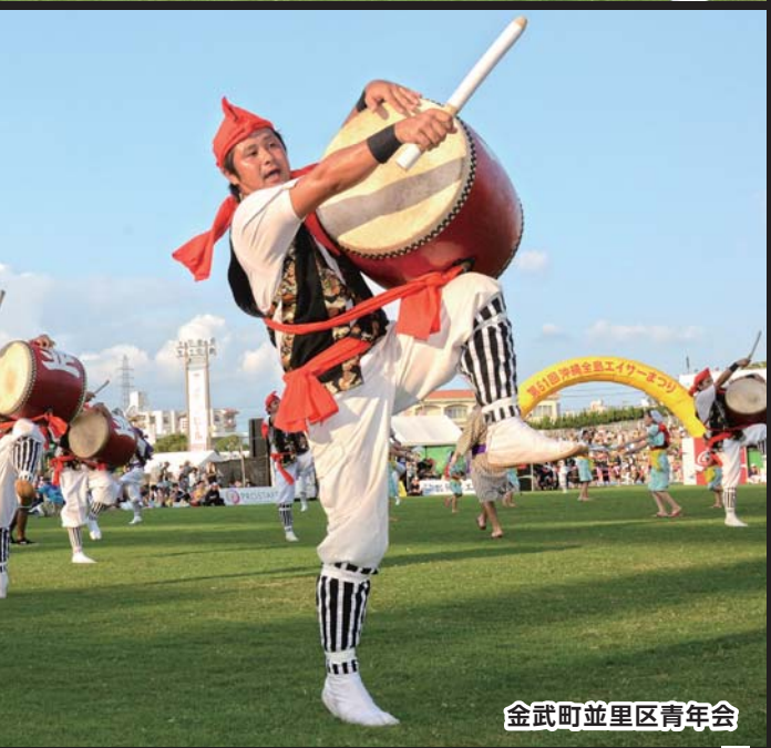
金武町並里区青年会