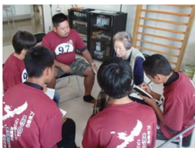
▲やすらぎ園の入所者から当時の悲惨な様子が語られた