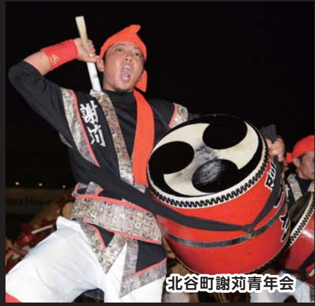
北谷町謝刈青年会