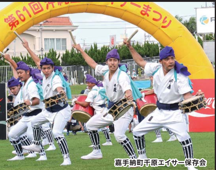
嘉手納町千原エイサー保存会