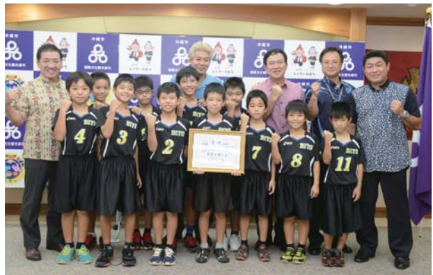
▶ ドリームカップでの健闘を誓う選手たち

美東男子バレーボールクラブが8月20日と21日に具志川総合体育館と兼原小学校体育館で開催された「ドリームカップ2016」第10回ジュニアオールスターバレーボールフェスタ出場権争奪 第4回中頭地区小学生バレーボール大会で準優勝し、10月1日と2日に佐賀県で開催される本戦への出場権を獲得した。選手らは9月9日に市の狩俣教育長を訪ねし出場報告を行った。狩俣教育長は「クラブ発足から1年半で結果を出しており、真摯に練習を積み重ねてきたことがうかがえる。佐賀県での優勝を願っている」と激励した。