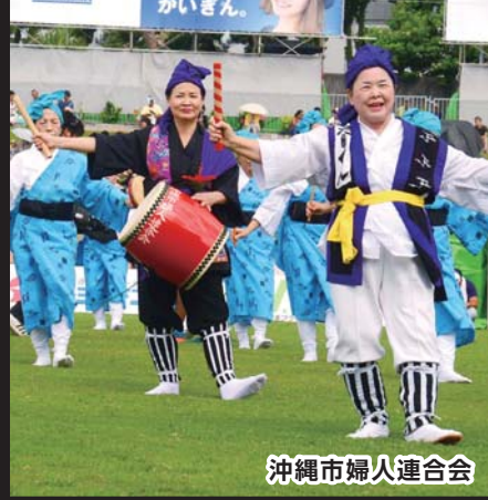
沖縄市婦人連合会