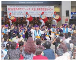
第5回世界のウチナンチュ大会沖縄市歓迎イベントの様子

■市史編集担当/TEL:929-4128(直通) ■ヒストリートヒストリートⅡ/TEL:929-2922