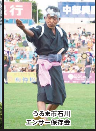
うるま市石川 エンサー保存会