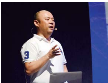
▲オープンイベントで自身の体験や考えを語った孫氏

8月5日にはオープン記念イベントがミュージックタウン音市場で開催され、起業家の孫泰蔵氏の講演や、様々な立場で活躍中のゲストらによるグループトークやディスカッションが行われた。また、市は7月28日に沖縄振興開発金融公庫、琉球銀行、コザ信用金庫と「創業及びスタートアップ支援に係る連携・協力に関する協定」を締結しており、金融機関とも連携して創業支援を行う。 所在…沖縄市中央1-7-8 コジーセントラル 営業時間…正午～午後9時 ※相談受付午後7時まで 定休日…正月、旧盆 ※臨時休業あり 電話… 080-3963-3355