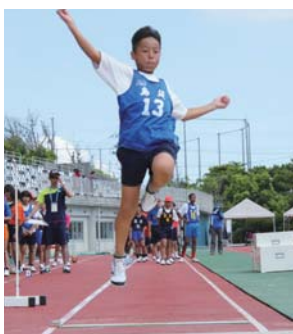
▲力いっぱいジャンプ!