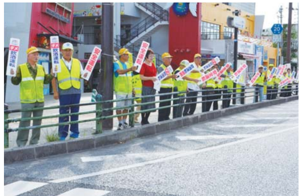
▶アイキャッチで飲酒運転根絶を呼びかける

式終了後に参加者は、飲酒運転根絶のサインボードを掲げて道路沿いの歩道に立ち、通行車にアイキャッチを行った。