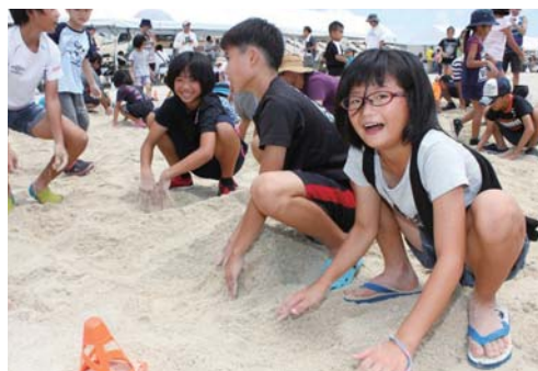
▲砂の中の宝を探せ!(宝探しゲーム)

パネルが展示された。また、会場には特設ステージが設けられ、太鼓やエイサーの演舞、フラダンスやヒップホップダンスが披露された。当日は天気にも恵まれ、807人が未来のビーチを一足先に楽しんだ。