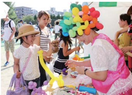
▲子ども達に人気のバルーンアート

て人気を集め、ステージでは作成した三線による演奏も披露された。まつり会場にはそのほかにも、ダンスコンテストや高校生バンドフェスタなどが催され、豊中市のキャラクターにちなんだワニ料理を楽しむ「I LOVE TOYONAKA」、歌やダンス、太鼓、ジャズ、ちんどん、エイサーなど、多彩なステージが楽しめる「市民ふれあい広場」、来場者も一緒に踊ることができる「盆踊り」、ダンボール迷路やジャンボかるた、おぼけやしきなどで楽しく遊べる「こども楽園」、ゴーヤー・ヘチマなどの緑のカーテンやハンギングバスケットが展示された「花とみどりの作品展」、様々な屋台が軒を連ねる「きらめき通り」「まいど商店街」「夜店」などが設営され、来場者を楽しませた。まつりは両日とも天気恵まれ、あふれんばかりの人出でにぎわった。