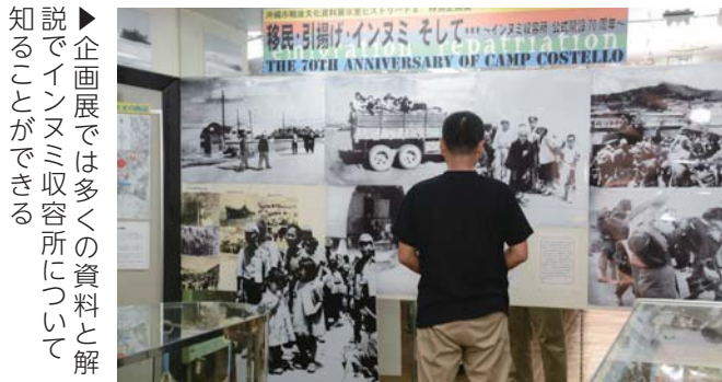
▶企画展では多くの資料と解説でインヌミ収容所について知ることができる

企画展は10月30日まで。ヒストリートⅡの開室時間は午前11時から午後7時。(月曜日と祝日は休室)