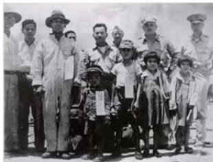
最初の引揚者を歓迎する軍と民政府の職員たち(1946年8月)

引揚者たちは全滅したとされる家族の安否と、将来に不安を抱きながらも久場崎港に降り立ちました。彼らは高原に開設された引揚民収容施設「インヌミ」を経て故郷へ帰り、自らの、沖縄の戦後復興にまい進します。