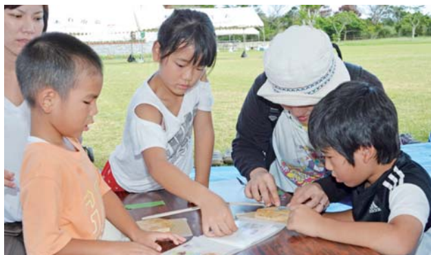
▶コースター作りに挑戦することも達