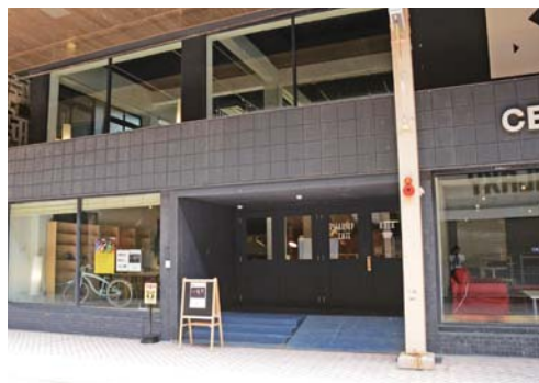
▲一番街商店街にオープンした「スタートアップカフェ コザ」