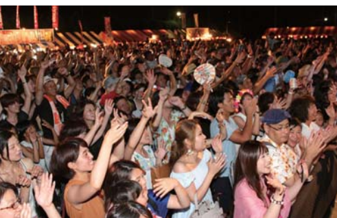
▲大きな盛り上がりを見せる会場