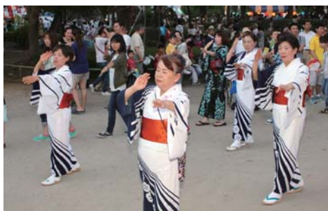
▲来場者も一緒に踊った盆踊り