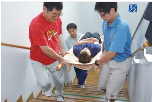
▶毛布と角材の応急担架を使用した搬送訓練