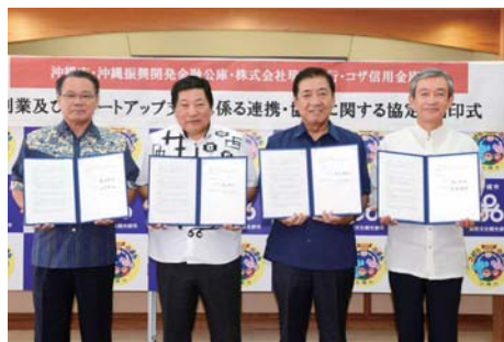
▲創業希望者支援のための協定を金融機関と締結