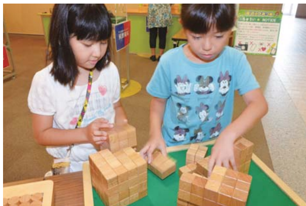
▶脳トレーニングにチャレンジ

カガクふれあい広場では、世界各地のカブト虫やクワガタなどの標本や、昆虫がふ化する様子の写真が展示されたほか、電磁石クイズや積み木を使った脳トレーニングゲームなどのコーナーが設置され、市役所に訪れたこども達は、楽しみながら知識を深めた。