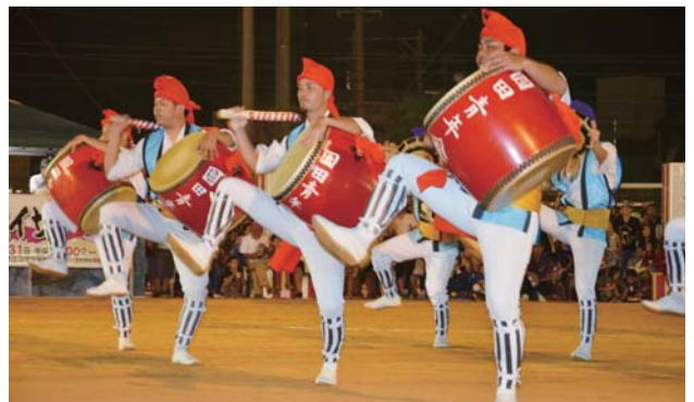
▶ 威風堂々と演舞する園田青年会