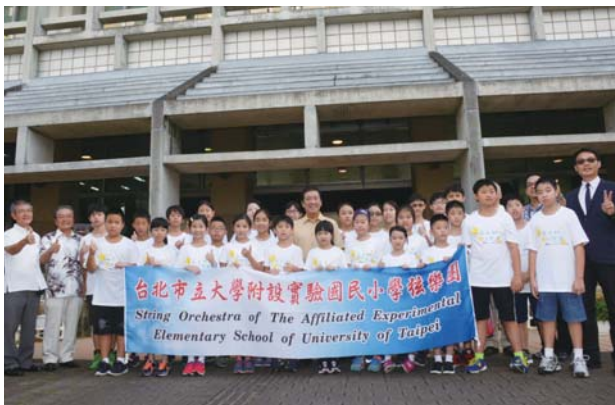
▲台北市立教育大学附設実験国民小学校弦楽団の子ども達

8月15日には出演者と関係者が市役所を訪れセレモニーが開かれ、桑江市長は「沖縄から一番近い外国である台湾から多くの皆様にお越しいただき嬉しく思う。音楽会を通して交流を深めて欲しい」とあいさつした。市と台湾は平成25年の沖縄国際アジア音楽祭Music X 2013をきっかけに交流が深まり、毎年音楽交流が行われている。