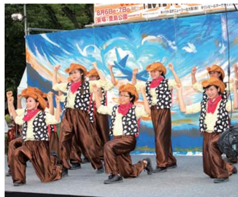
▲多くの豊中市民が登場した「I LOVE TOYONA KA」ステージ