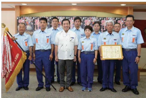
▶ 日々訓練に励んでいる消防団員

団員は一般市民で、仕事を終えてから訓練を行っている。8月12日には桑江市長を訪ね、近況報告と大会に向けての抱負を語った。