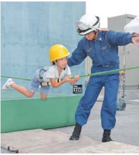
▲ロープを使ったレスキュー体験 ▲サイレンを鳴らして出動