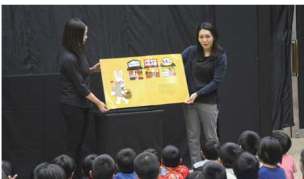
▶大型絵本の物語に聞き入る子ども達

ボランティアゆいゆいが出演し、ストーリーテリングや大型絵本の読み聞かせ、人形シアター、黒いパネルを舞台に絵人形を貼り付けて演じるブラックパネルシアター、ペープサート(紙人形劇)など、様々な手法で物語を演じた。参加した子ども達は、かわいらしい人形の登場やハラハラドキドキするストーリーに引き込まれ、次々と披露される物語の世界を楽しんだ。