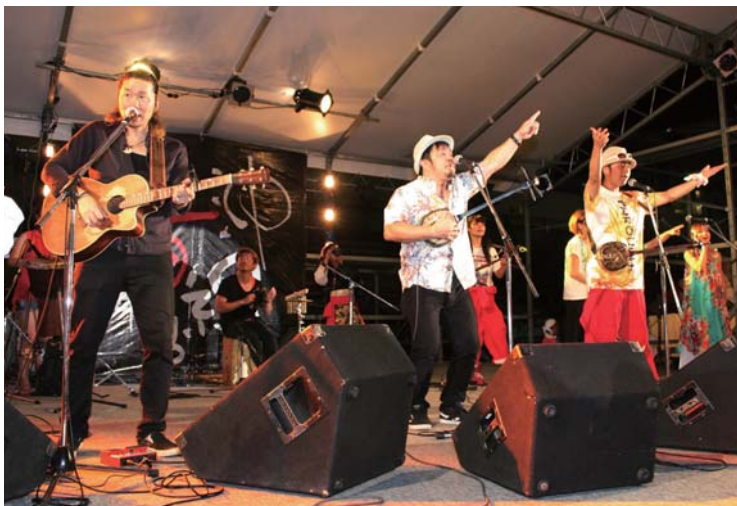
▲沖縄のアーティストがまつりを盛り上げる