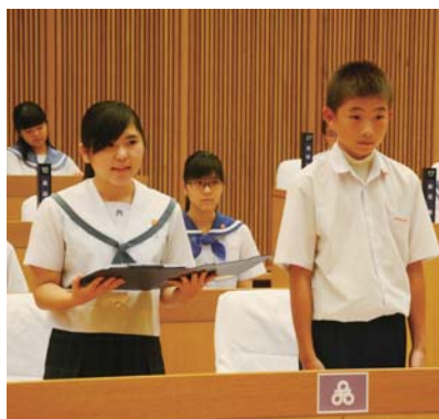
▲子ども議会では様々な分野の質問や提案が行われた

議会では5月から研修を重ね、市に関する知識を深めてきた市内8中学校の生徒30人が、障がい者にやさしいまちづくり、子どもの居場所づくり、ミュージックタウンの活用、エイサーのまちの取り組み、ゴミ問題などについて中学生の視点で質問と提