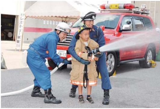
▶火の的にめがけて放水

会場の市消防本部屋外では、レスキュー体験やポンプ車放水体験、ミニ消防車周回体験、ロープ結索体験などがあり、防