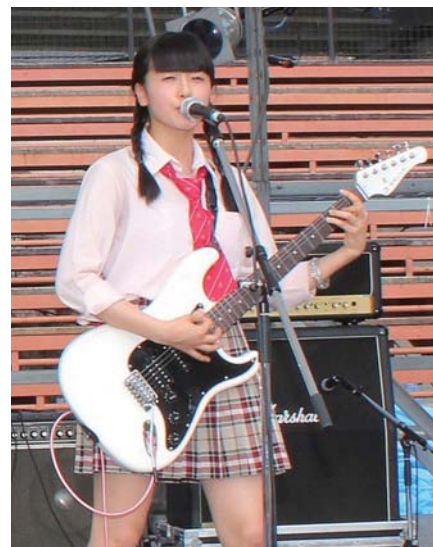
▲来年のピースフルラブ・ロックフェスティバル に出場決定[ビリー→部]