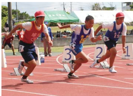
▲ゴールを目指し全力疾走

大会には市内16小学校から約500人が出場し、短距離走りやリレーなどのトラック競技と走り高跳びやボール投げなどのフィールド競技が学年別で行われた。