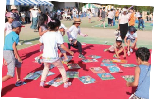
▲ジャンボかるたに熱中