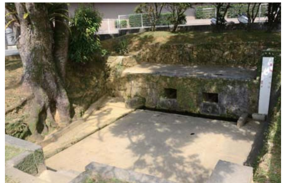
▶産湯の水を汲んだヒージャガー(市指定文化財)

と、沖縄子どもの国の協力を得て宮里小学校で「宮里チャレンジカップ2016エアロケット」を開催した。催しは、ペットボトルや牛乳パックを材料に、空気で飛ぶロケットを制作し、その飛距離を競うもので、多くの親子が参加し、飛距離を伸ばそうと試行錯誤した。