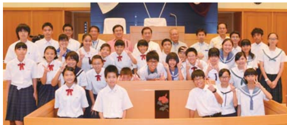
▲第3回子ども議会の議員たち

案を行い、桑江市長らが答弁した。また「沖縄市子ども議会の発展と普及に関する決議書」が全会一致で可決され、狩俣教育長に提出された。議会終了後に狩俣教育長は「みなさんの質問は的を射っており、市議会でも重要と考えられているものだった。また、子ども議員ならではの大人では気づきにくいユニークな提案もみられた」と講評した。子ども議員たちは、今後、これまでの活動をまとめ、各学校で報告会を行う予定となっている。