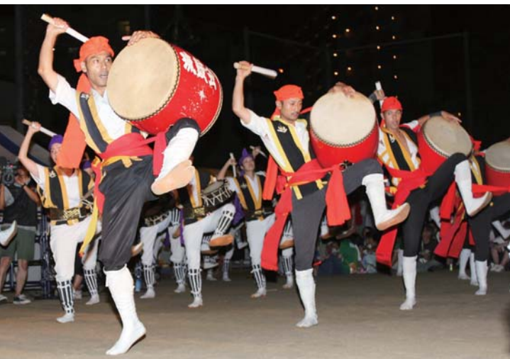
▲琉鼓会のエイサー演舞