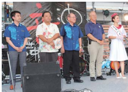
▲沖縄市からの参加者もステージに