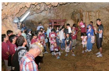
▲クマヤーガマではガマの説明と体験が行われた