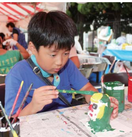
▲シーサーを好みの色に