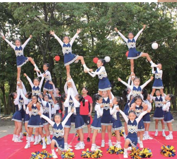
▲子どもたちのハイレベルなチアリーディング