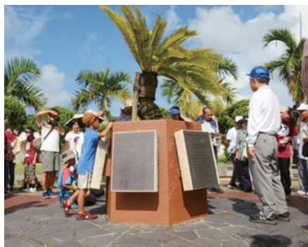
▲降伏調印式の碑に見入る参加者

を深めた。沖縄戦降伏調印式の碑は旧越来村森根(現沖縄市)に位置し、米軍と南西諸島の日本軍との間で降伏調印式が行われた場所に建てられている。奉安殿は天皇皇后両陛下の写真「御真影」や教育勅語を保管した建物で、忠魂碑は戦死した日本軍人を慰めるために建立された。奉安殿と忠魂碑は明治時代から全国に建立されていったが、戦後に大半が取り壊された。 市は、沖縄戦の実相や歴史的背景を伝え、平和について考える機会にしておらおうと戦跡めぐりを実施している。