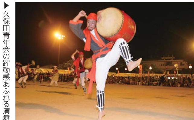
▶ 久保田青年会の躍動感あふれる演舞

まつりには、東青年会をはじめ、市内外の青年会など10団体が出演し、エイサー演舞を披露したほか、「風のどなん」でおなじみの西泊茂昌さんがゲスト出演して音楽ライブを行い、会場を盛り上げた。まつりの最後には、恒例のカチャーシーが行われ、出演者と観客が入り交じって踊った。