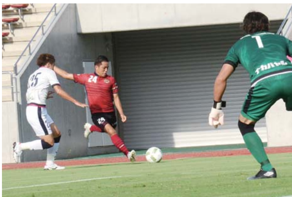
▶ 果敢な攻めでゴールをねらうFC琉球