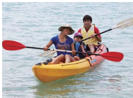
▲シーカヤック体験を楽しむ親子

イベントは東部海浜で整備が進められているビーチを会場に開催されたもので、スイカ割りやビーチドッジボール大会、砂に埋まっている宝物を探す宝さがしゲーム、海の生き物とふれあえるタッチプール、シーカヤック体験教室、たこあべが行われたほか、事業PRの