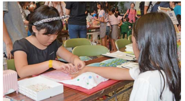
▶客の爪を丁寧に飾る店員