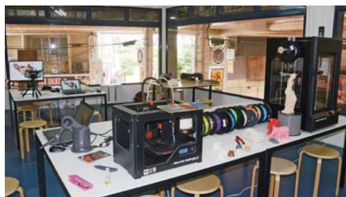
▲3Dプリンターやレーザーカッターを備えた別館「オキナワ ミライ ファクトリー」

一番街商店街に8月5日、創業や起業を総合的に支援する「スタートアップカフェコザ」がオープンした。同カフェは、創業に関する相談や短期間での急成長をねらうスタートアップ育成とプログラミングの教育施設、3Dプリンターやレーザーカッターを使用したものづくりサポートをするFAラボを備えた施設で、創業希望者をワンストップで支援する。