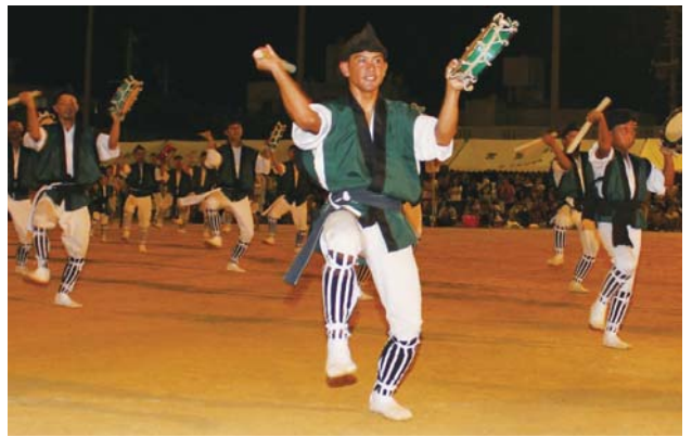
▶ 勇壮な演舞で会場をわかせる東青年会

第16回 風山祭(同実行委員会主催)が7月26日に山内中学校のグラウンドで開催された。まつりは地域の活性化や青少年の健全育成を目的としており、山内中学校区の青年会を中心に、学校や自治会、地域、企業などが協力して開催された。まつりには山内中学校区の各青年会をはじめ、南桃原と諸見里のことも会が出演したほか、市内外の青年会や団体が友情出演し、エイサー演舞を披露した。また、山内中学校吹奏楽部の演奏やマハロウラ・スタジオのフラダンスも披露され、最後はカチャーシーで盛り上がった。