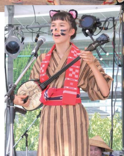
▲赤瓦三線会の演奏