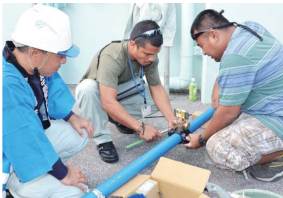
▲給水引込みの技術指導を受ける研修生

研修は、島嶼国（複数の島で構成される国）における適応性の高い水資源の管理と効率的な利用方法など、同じ島嶼である沖縄での技術や経験を学ぶことを目的に行われており、本市では配水や運用システム システム の講義、漏水修繕や給水装置取付の実習などで、実践的な技術を学んだ。