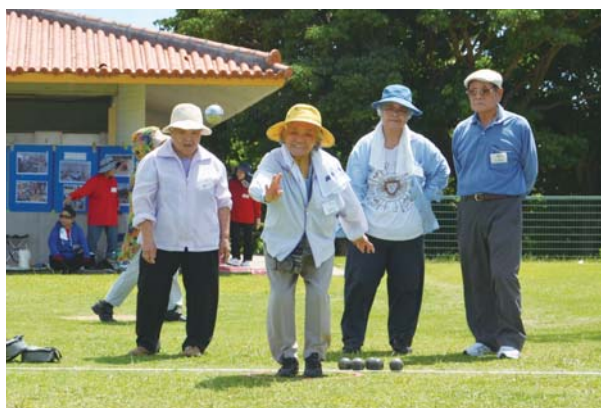
▲狙いをさだめて投球

ペタンクとは、地面に描いたサークルを基点として木製の目標球（ビュット）に金属製の球を投げ合って、よりビュットに近づけることで得点を競うスポーツ。相手チームの球やビュットに球をあてて動かすことで状況を変えることもできる。大会には3人一組の65チームが参加者し、ペタンクを楽しんだ。