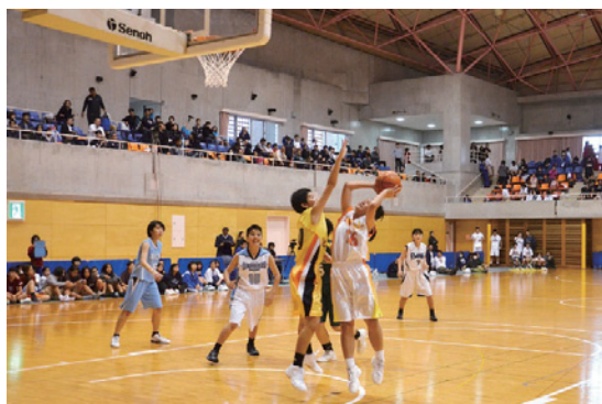
▲粘り強いプレーを魅せた市中学選抜女子チーム