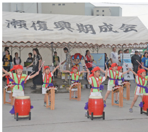
▲太鼓の演舞で歓迎する園児たち