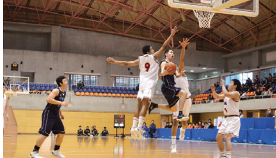
▲市内高等学校選抜チームも好ゲームを展開