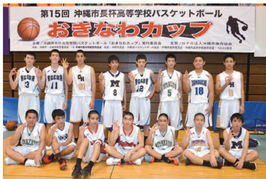
▲市中学選抜男子チームのメンバー

第15回沖縄市長杯高等学校バスケットボールおきなわカップ(同実行委員会主催)が、3月26日と27日の2日間、市体育館で開催された。おきなわカップは、県内外のバスケットボールの強豪校を招聘し、青少年の健全育成と本市のスポーツ振興に寄与するとともに、地域の活性化を図ることを目的に行われている。