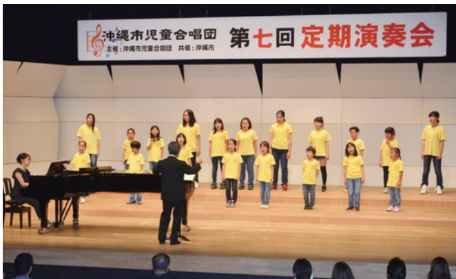
▲息の合ったハーモニーを披露