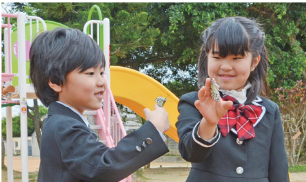
▶オオゴマダラを放つ園児

セレモニーは、今年で6回目、園児らで蝶を飼育することで、命を大切にすることや生き物を育てることの難しさを学ぶことを目的に行われている。浦崎園長が「幼虫の時期から大切に育てたオオゴマダラに、皆さんの夢や希望をのせ、未来に向かって一緒に飛ばしたいください」と挨拶した。園児らは、オオゴマダラの歌を合唱した後に蝶を放ち、大空を羽ばたく様子に歓声をあげた。