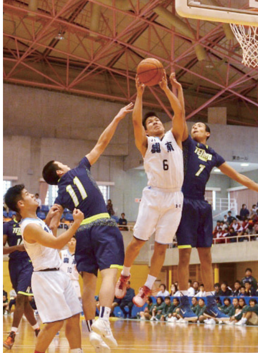
▲1・2位決定戦では激しい攻防戦が繰り広げられた