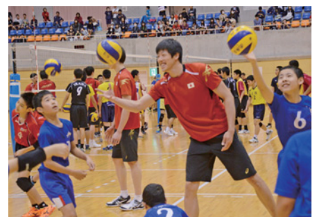
▲バレーボール教室で選手と一緒に練習する生徒達