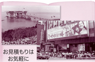
お見積もりは お気軽に

家族や友人への感謝、故郷の 記憶、仕事への情熱、幼いころ の夢。あなたの人生を1冊の 本として、残してみませんか? 沖縄タイムスの元記者が講師 としてお手伝いしますので、 あなただけの自分史作成に 安心して取り組みます。