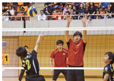
▲全日本男子チームとの試合