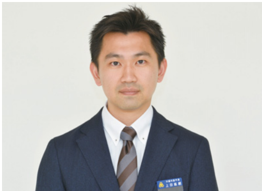
▶副市長に就任した上田紘嗣氏