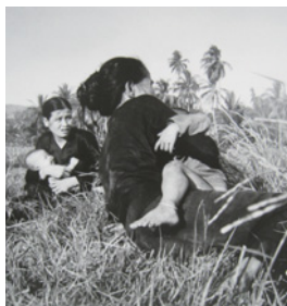
村には、まだ子どもたちがベトナム(ビンディン省)1966年

■市史編集担当/ TEL:929-4128(直通) ■ヒストリート、ヒストリートII/ TEL:929-2922