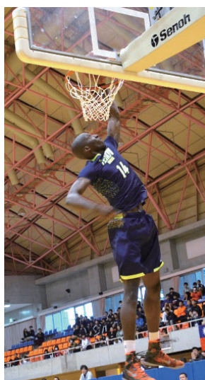
▲迫力のあるダンクシュート