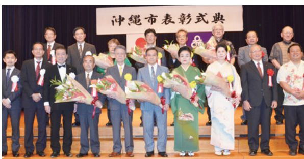
▲市政発展に貢献した被表彰者