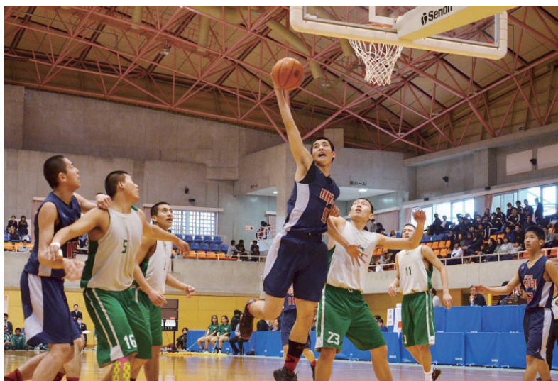
▲力と技のぶつかり合い