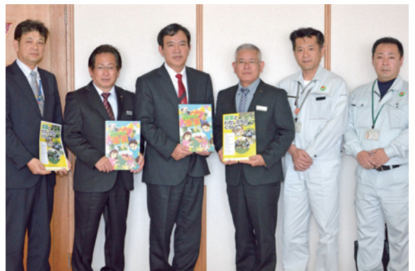
▶JAおきなわ美里支店とコザ支店の支店長らが補助教材を贈呈

贈呈された補助教材は、JAバンク食農教育応援事業の一環で制作されており、3月下旬に市内の小学5年生全員に配布され、こども達が農業に関心を持ち学べるように、イラストや写真、グラフなどが多く使われた教材本となっている。