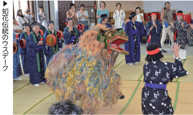
知花伝統のウステーク

デークともいう)は300年の歴史を持つ。ウステークは、獅子を中心に知花花織を身にまとった女性達が輪になって踊り、健康と五穀豊穡を祈る伝統行事で、旧暦の8月15日に行われている。また、知花は陸上競技に力を入れており、昨年は市陸上競技大会優勝を目標に取り組み、男子・女子・総合の全ての部門で優勝した。宇良会長は「知花は歴史がある地域なので、伝統を継承しながら新しい風も吹き込んでいきたい」と話している。 電話：9371-4516