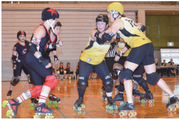
▲激しい攻防戦を展開

女子の国際大会がアジアで開催されるのは初で、大会には日本、アメリカ、オーストラリア、ニュージーランド、デンマークから10チームが出場した。