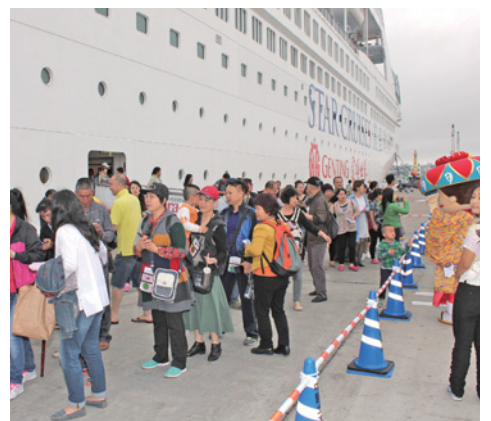
▲中城湾港に降りるスーパースター リブラの乗客