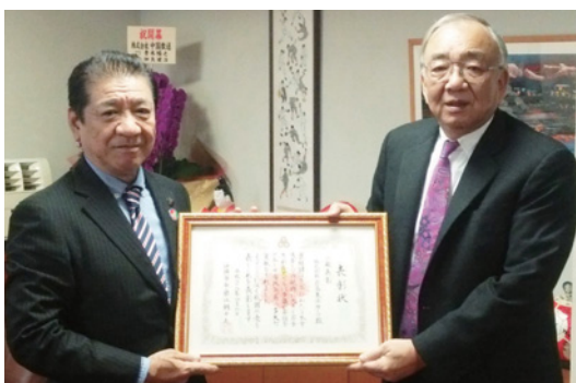
▲市へ一億円の寄付のあった広島東洋カープにも表彰状と記念品が贈られた