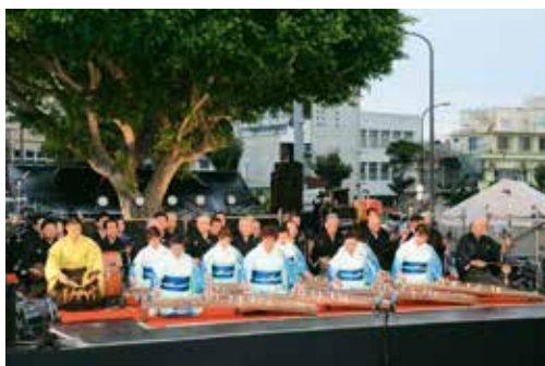
▲幕開けを飾った沖縄市芸能団体協議会の演奏