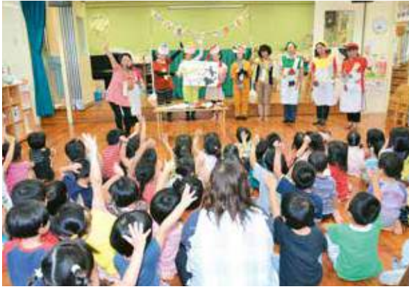
▲好き嫌いしないで食べると約束をする園児たち

市母子保健推進員による食育劇は、年間約8回のペースで、公立や私立の保育園で開催されており、食育劇を見終えた園児らは「お腹がすいたよ、好き嫌いしないでなんでも食べるよ」と話した。