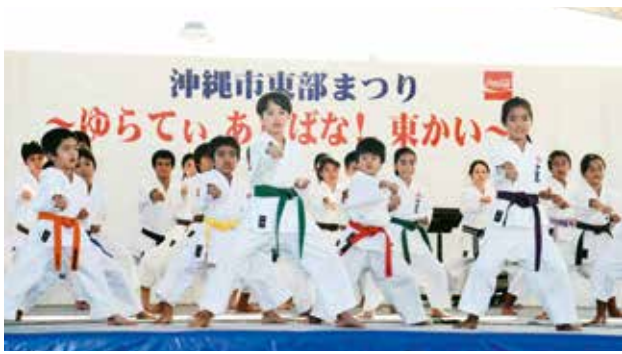
▲まつりで空手の演武を披露することも達

まつりでは、市防災課や市消防本部、市東部地区自主防災組織、沖縄気象台、自衛隊協力本部、沖縄警察署などが災害機器やパネルを展示し、自衛隊自炊車両によるカレーの炊き出しも行われた。野外舞台では沖縄民謡や琉球舞踊、獅子舞、