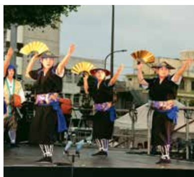
▲国選択の民俗文化財「泡瀬京太郎」