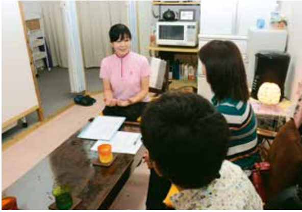
▲店主らが講師を務め、様々な講座が開かれた