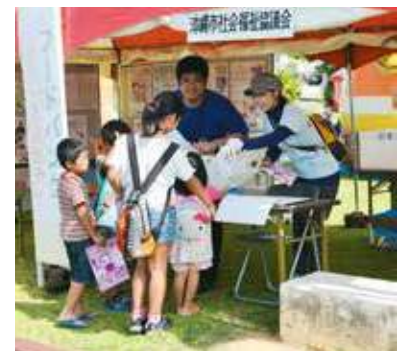
▲フードバンクに食料を提供する子ども達