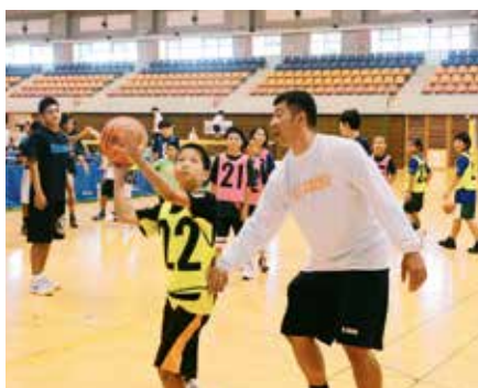
▲元プロから指導を受けたミニバスケットホール教室