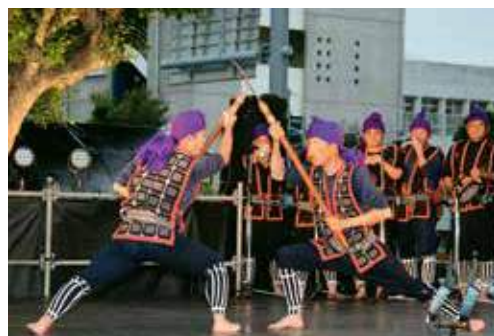
▲座喜味棒の迫力ある演武