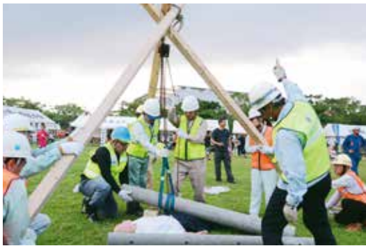
▲市東部地区自主防災組織による、がれきからの救出訓練

また、会場内では東部海浜フェスタも開催され、東部海浜開発事業を紹介するパネルが展示されたほか、ダンスや大道芸、科学実験講座などのステージイベント、泡プールのアロマのリラクゼーション