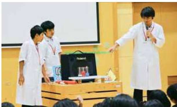
音でロウソクは消せるかな?

今回のフェスタでは、山内中学校科学部に所属する10人の生徒が、赤・青・緑色の光を合わせ、様々な色をつくる「光の実験」やスピーカーから出される音を利用し、コップの中にあるロウソクの火を消す「音の実験」を披露し、訪れた約70人のこども達は、科学のおもしろさを学び楽しんだ。