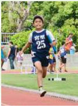
▲小学校男子6×100mリレー (宮里) 1分42秒49