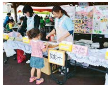
▲手作りおやつは美味しいよ