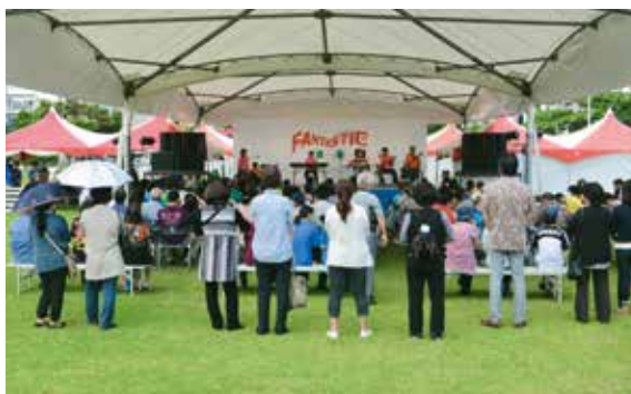
▲オープニングを飾るケントミファミリーのステージに集まった来場者