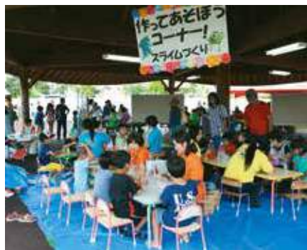
▲遊びのコーナーで工作を体験