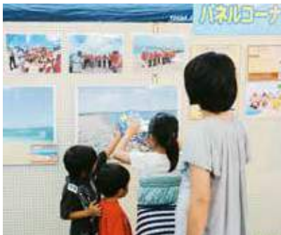
▲楽しく学べる東部海浜開発事業パネル展