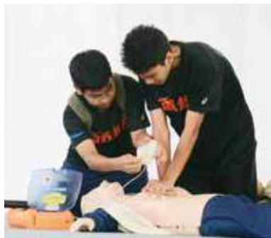
▲沖縄東中の救急救命寸劇