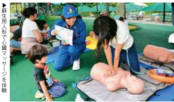
▶蘇生用人形で心臓マッサージを体験

上の心肺停止した選手に救命活動を行うアトラクションも披露され、会場を訪れた観客らは、イベントを楽しみながら、救急医療について学んだ。