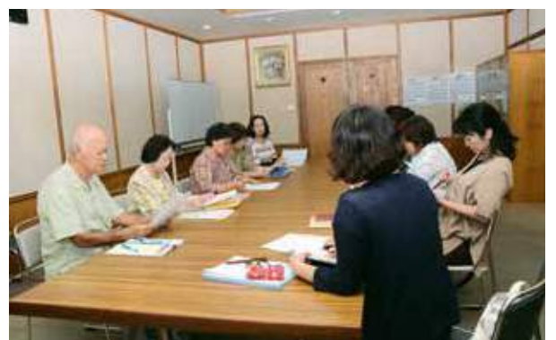
定例会で話し合う各団体のメンバー

自発的活動支援事業の定例会が9月28日に市役所で開かれた。 同事業は、障がい者やその家族が日常生活を営むうえで生じる悩みを共有し、支援することで共生社会の実現を図ることを目的に、身体・精神・知的の障がい者を支援する各団体が、悩みごとの相談や社会参加のための情報提供を行っている。定例会には各団体が集まり、情報の共有や、連携の強化が図られた。支援団体の「ピアサポートセンターなかま」では知的障がい、「おあしすコール」では精神障がい、「ピアサポートセンターつなぎ」では身体障がいの相談を受け、サポートしている。