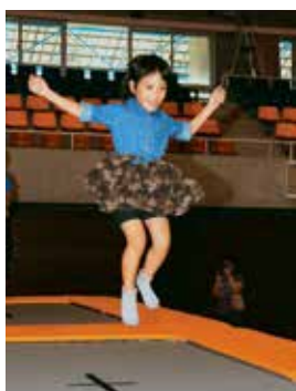
▲トランポリンで大ジャンプ

催しでは、反復横跳びや上体起こし、シャトルランなど、年代別に6種類の運動を行い、体力年齢を測定する新体力テストや卓球、バドミントンの体験コーナーが設置され、多くの市民が家族や友人