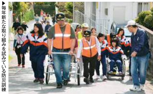
▶毎年新たな取り組みを試みている防災訓練