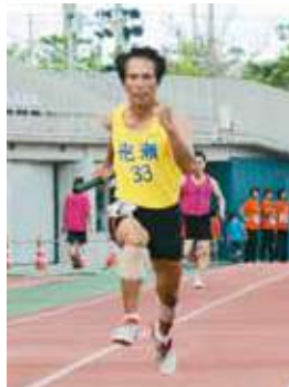
▲壮年男子4×100mリレー (泡瀬) 53秒24