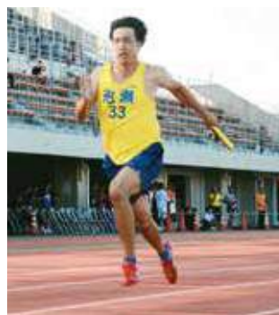
▲一般男子4×100mリレー (泡瀬) 44秒82