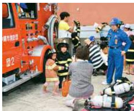
▶消防士姿で記念撮影