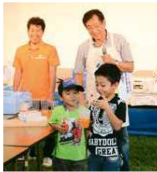
▲オレンジジュースにドライアイスを入れると？(科学実験講座)

ワークショップなどで来場者を楽しませた。4日には東部海浜大花火も行われ、会場は多くの観客でにぎわった。