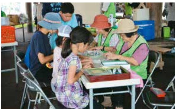
▲かりゆしシニアクラブによる昔ながらのおもちゃ作り