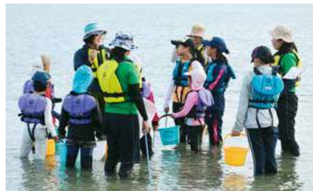
生き物の説明を聴く児童たち

放課後自然体験遊び(市こども家庭課主催)が、9月24日に泡瀬干潟で、NPO法人国際自然高等学校沖縄校のスタッフを講師に迎え、小学生を対象に行われた。 団体遊びは、自治会を起点とした児童の居場所づくりや外遊びを通して、こどもの成長を支援する目的で行われ、今回、泡瀬自治会の協力のもと開催された。参加した児童らは、バケツとすくい網を持って干潟に入り、みつけたカニやヤドカリ、寶貝、巻貝などについて説明を受けたり、海の中で遊んだり自然体験遊びを楽しんだ。