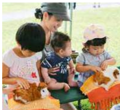
▲モルモットは温かくてふわふわ