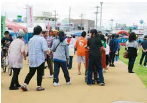
▲会場は子ども大盛況