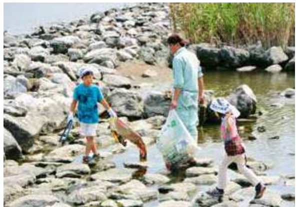
▲子ども達も清掃活動をお手伝い

清掃作業には、沖縄市建設産業協議会や自治会などの市民団体、民間企業やNPOなどの法人団体、沖縄総合事務局や沖縄県などの行政機関が参加し、約340人が、県総合運動公園の隣にある比屋根湿地と湿地前の泡瀬海岸で、ゴミの収集や除草、伐木などを行い、貴重な湿地環境を守る清掃活動を実施した。