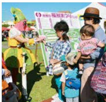
▲赤い羽根募金を呼び掛けるピエロのファンキー

容のパネル展示や手工芸品のバザーなどが行われ、体験コーナーの昔ながらのおもちゃ作りや、ふれあい動物園をはじめ、多くの人で賑わった。また、市社会福祉協議会のブースでは、フードバンクの受付が行われ、両日合わせて約225kgの食料が寄せられた。