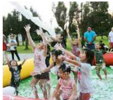
▲泡プールで、はしゃぐ子ども達

ワークショップなどで来場者を楽しませた。4日には東部海浜大花火も行われ、会場は多くの観客でにぎわった。