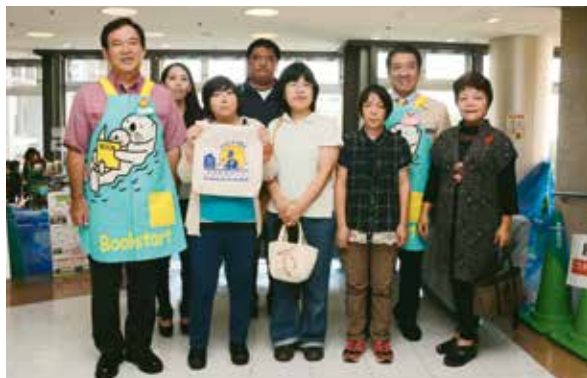
オリジナル絵本バッグの製作メンバーと市長、教育長