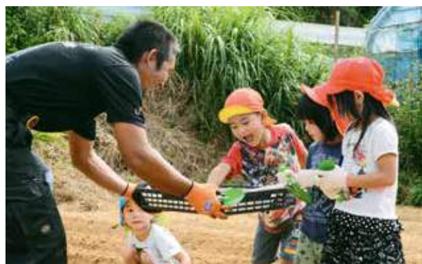
種イモを受け取り笑顔の園児

体験は、こども達に作物を育てる苦労と喜びを感じてもらい、食の大切さを学んでもらおうと実施されたもので、沖縄市は、都市型農業のため農地が限られていることから、こども達が農業に触れる機会を作ろうと計画していた、市農業青年クラブが全面的に協力した。体験では同クラブの指導のもと、越来保育所の4歳と5歳の園児がじゃがいもを植え、体験後、園児からは「もっとやりたい」との声が上がった。