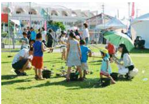
▲空き缶を使った魚釣り遊び

容のパネル展示や手工芸品のバザーなどが行われ、体験コーナーの昔ながらのおもちゃ作りや、ふれあい動物園をはじめ、多くの人で賑わった。また、市社会福祉協議会のブースでは、フードバンクの受付が行われ、両日合わせて約225kgの食料が寄せられた。