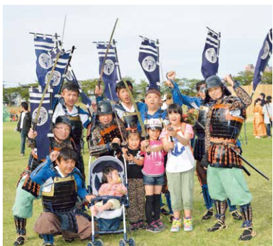
▲合戦後は、みんなで記念撮影