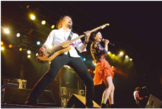
▶ステージを駆け回るHeaven's Hempのステージ