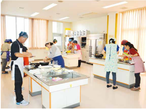
▲楽しみながらも熱心に学ぶ参加者たち

参加者らは、弁当のおかず作りをとおして自分にあつた必要な量や食の大切さを学んだ。