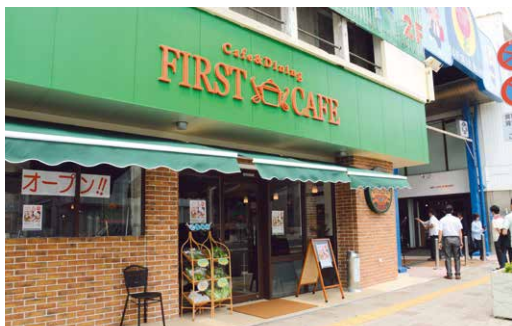
▲一番街商店街にオープンしたFIRST CAFE

は、障がい者の自立支援などに取り組むNPO法人初穂が、市一番街商店街振興組合と共同で商店街の活性化を図ろうとオープンした食品加工の工場を併設したカフェ。年中無休で早朝6時から午後10時まで営業する。 プラザハウスショッピングセンター入り口に設置されたLEDサイネージは、261インチの大型電子看板で、広告で使用するほか、公共機関の情報発信も行う。ライカムアンソロポロジは1950年代の琉米文化をテーマにした交流スペースで、当時の写真や書籍などが展示されており、無料で入場できる。 地域商業自立促進事業は、商店街などにおける地域コミュニティの形成と活性化を図る取り組みで、魅力創造の向上を支援している。