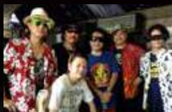
KENICHI & KING VOICES