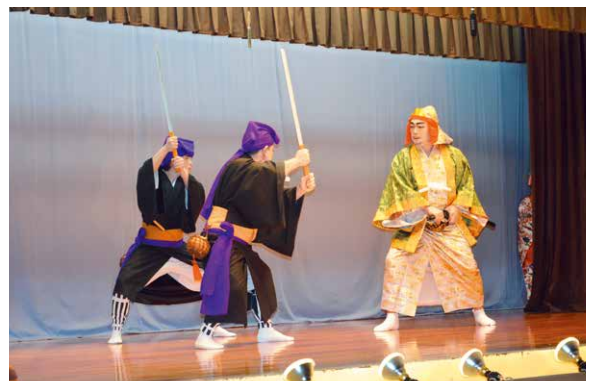
公民館まつりで4年に1度披露される組踊「万歳敵討」