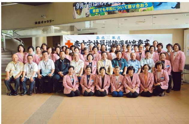
▲出発式に集まった沖縄市赤十字奉仕団のメンバー

赤十字奉仕団では、赤十字の活動を支える赤十字社員を募集し、社資(募金)の協力を呼びかけると同時に、共に活動する奉仕団員を募集している。