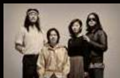
구남과여라이딩스텔라 GOONAM (韓国)