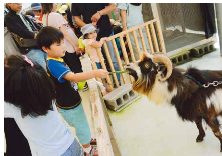
▲ふれあい広場でエサあげ体験