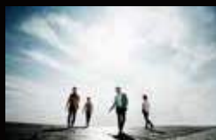
Sky's The Limit