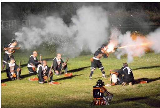
▲砲術隊が出陣の号令で発砲（武禊式）

5月2日と3日は、戦国時代に上杉謙信と武田信玄が対峙した川中島の合戦が再現された。2日は、上杉謙信が合戦前に戦勝祈願として行った武禊式が再現された。最終日の3日は、甲冑姿の武将が市内を練り歩く上杉軍団行列に続き、河川敷では川中島合戦が再現された。多くの観客が訪れた米沢市の一大イベントは、大盛況の内に幕を閉じた。