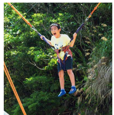
▲バンジートランポリンで絶叫