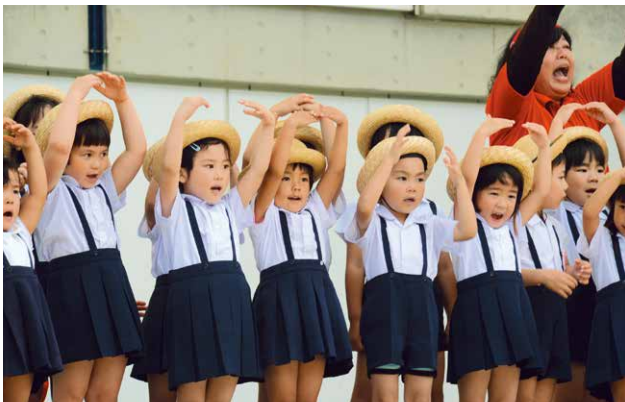
▲元気に歌を披露した愛星幼稚園の園児たち