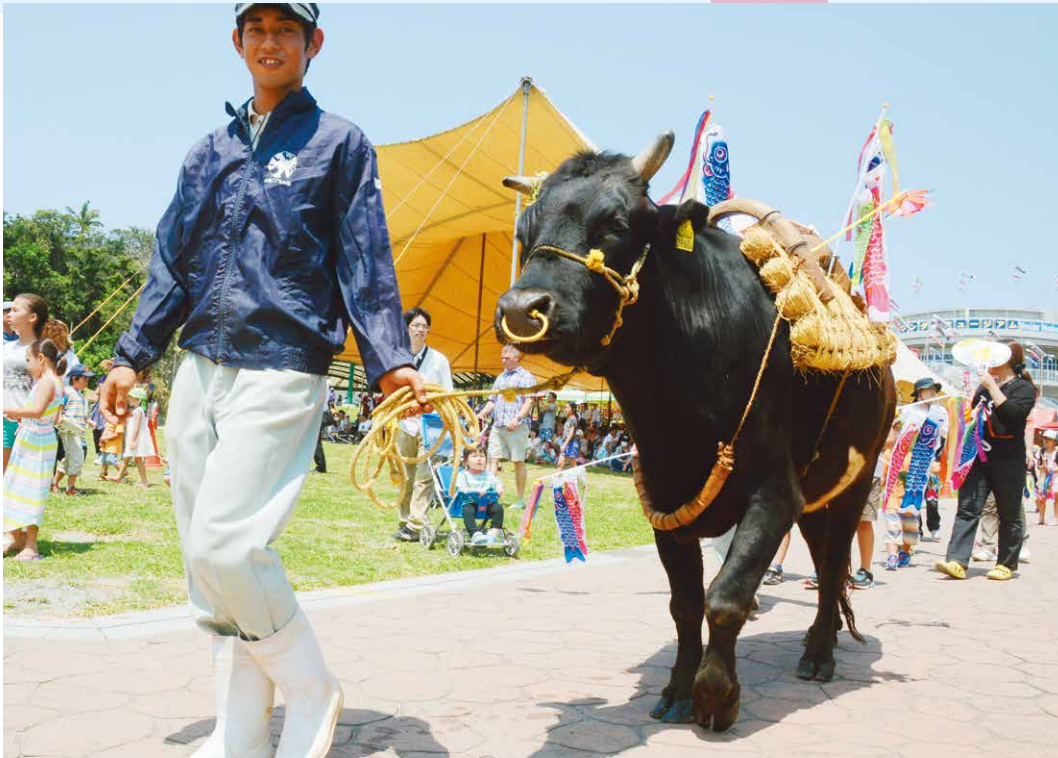
▲牛や馬、ヤギ、フクロウ、ヘビなど、たくさんの動物が登場した動物パレード