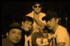
南風原ビーバップス