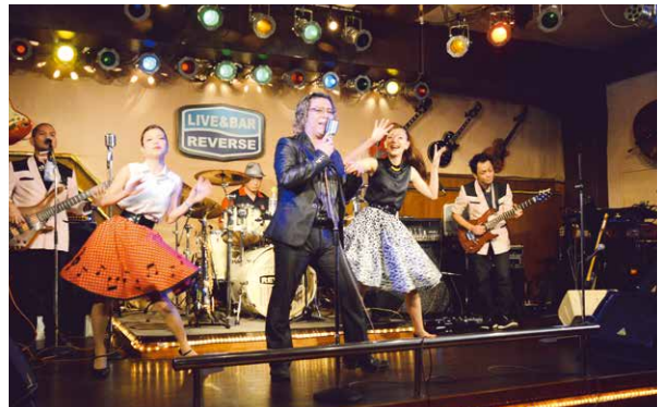
▶オールディーズ音楽で観客を楽しませるREVERSE

きる。ライブハウスサーキット初日は、LIVE & BAR REVERSEで開催され、専属バンドのREVERSEとゲストのAcoustic Mが出演し、オールディーズ音楽中心のライブで盛り上がった。 問合せ:コザライブハウス連絡協議会事務局 電話:070-5418-6819 詳細はWEBサイトから もご確認できます。 URL://www.kozalives.com/