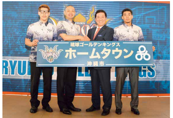
▶握手をするキングスの木村代表(左から2人目)と桑江市長(同3人目)