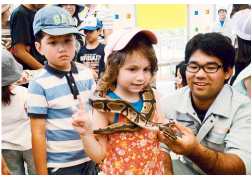
▲首にヘビを巻いてもらったよ

沖縄こどもの国で毎年ゴールデンウィークに開催されている恒例の人気イベント「沖縄こどもの国フェスティバル」が5月2日から6日までの5日間の日程で開催された。フェスティバル期間中、同園の動物園やワンダーミュージアム、水とみどりの広場のステージでは様々なイベントが催され、連日、大勢の来場者でにぎわった。