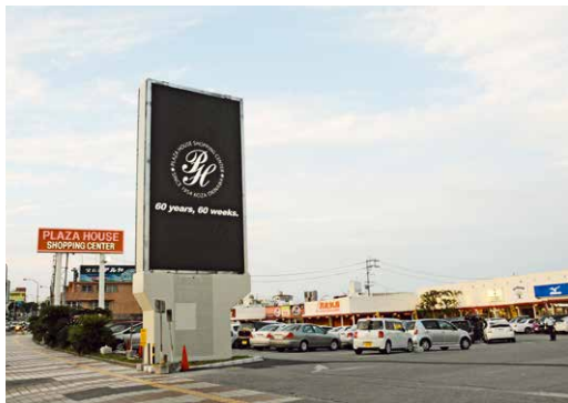
▲プラザハウスショッピングセンターに設置されたLEDサイネージ

国の平成26年度地域商業自立促進事業の補助金を活用し、4月22日、NPO法人初穂が胡屋バス停近くにFIRST CAFEをオープンした。また、24日にはプラザハウスショッピングセンターが同補助金を活用し、屋外大型LEDサイネージ(電子看板)や館内デジタルモニターの設置、ライカムアンソロポロジの開設を行った。