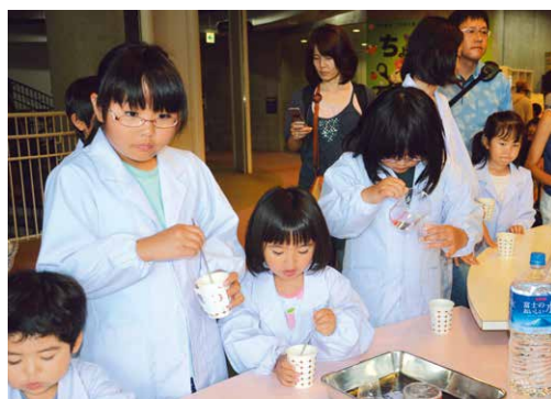
▲ケーキ作りでおいしい実験