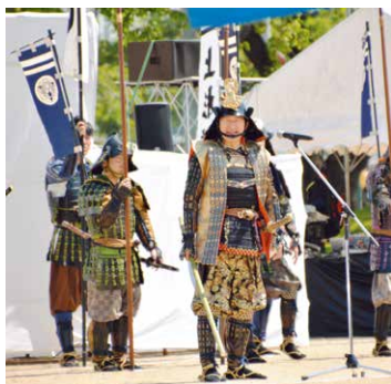
▲甲冑姿で挨拶する安倍米沢市長