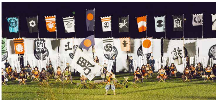
▲武禊式で先手の大将に刀八毘沙門天の旗が渡された