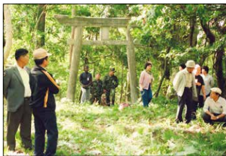
御殿敷の旧九月九日行事。鳥居の下で米軍が待機する(1990年10月)

戦前から戦後を通し、コザ・美里の人々は、一変したり消えたりした街並みのなかで、「今日を・明日を」どのように生きてきたのでしょうか。一緒に考えてみませんか。