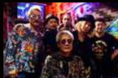
Sideways Special Band