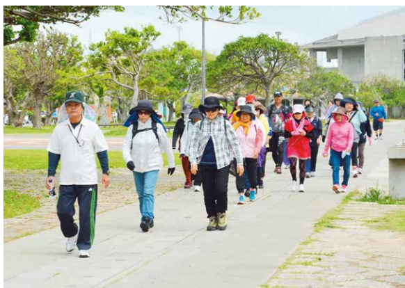
▲青空のもとウォーキングを楽しむ参加者たち

ウォーキングを始めたいと思っている方や初心者の方を対象に、正しいウォーキングの方法を学び、楽しさを実感してもらおうと、4月28日に県総合運動公園で初心者向けウォーキング講座(市民健康課主催)が開催された。講座当日は天候に恵まれ、参加者は講師の運動指導士からウォーミングアップや歩き方の指導を受けた後、2.5kmのコースを45分かけてウォーキングし、爽やかな汗を流した。講座参加者からは「テッポウユリが満開に咲いているコースを歩き、心も体もリフレッシュできた」と好評だった。