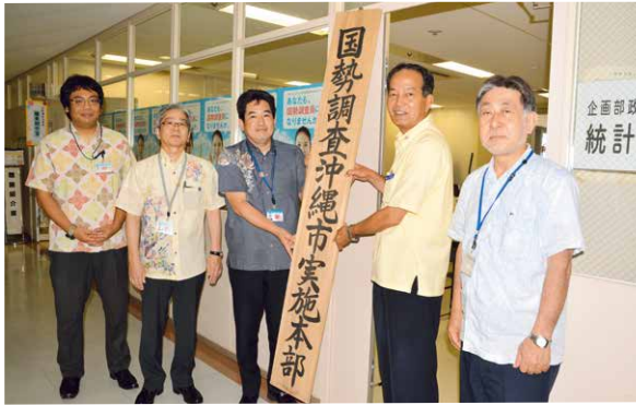
▶実施本部の看板を掲げる仲本副市長（右から2人目）と職員