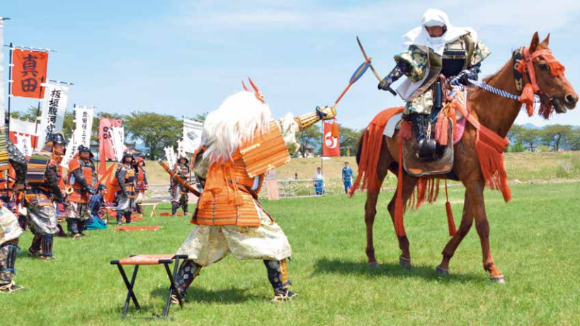
▲上杉謙信と武田信玄の一騎打ち「三太刀七太刀」の名場面

初日は、上杉謙信が祀られている上杉神社の例大祭が行われ、色とりどりの衣装を身に纏った市民らが様々な踊りを奉納した。2日目は、上杉神社の摂社で上杉家に縁のある方々が祀られている松岬神社の例大祭が行われた。