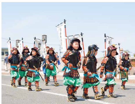
▲子ども達も上杉軍団行列に参加

上杉の城下町 米沢市は、山形県の最南端に位置し、上杉謙信を家祖とする米沢上杉家2代目の景勝が越後から会津を経て米沢に入封して以来、上杉の城下町として発展してきた都市です。