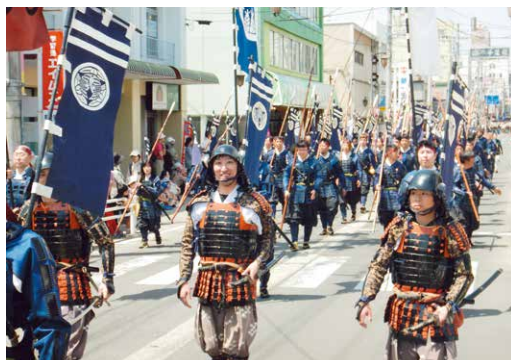
▲目抜き通りを練り歩く上杉軍団行列