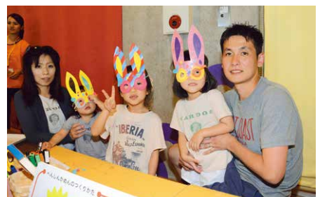
▲仮面を作って変身!