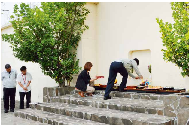
▲ご馳走をお供え、線香を立てる様子

市納骨堂は、納骨されている遺骨を平成25年度に整理しており、現在、戦没者や無縁仏など約1,200柱が合祀されている。