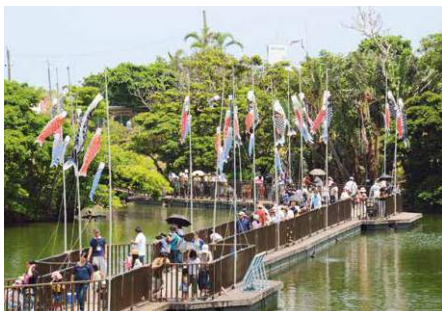
▲多くの来場者でにぎわったこどもの国