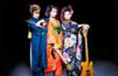
RUN it to GROUND