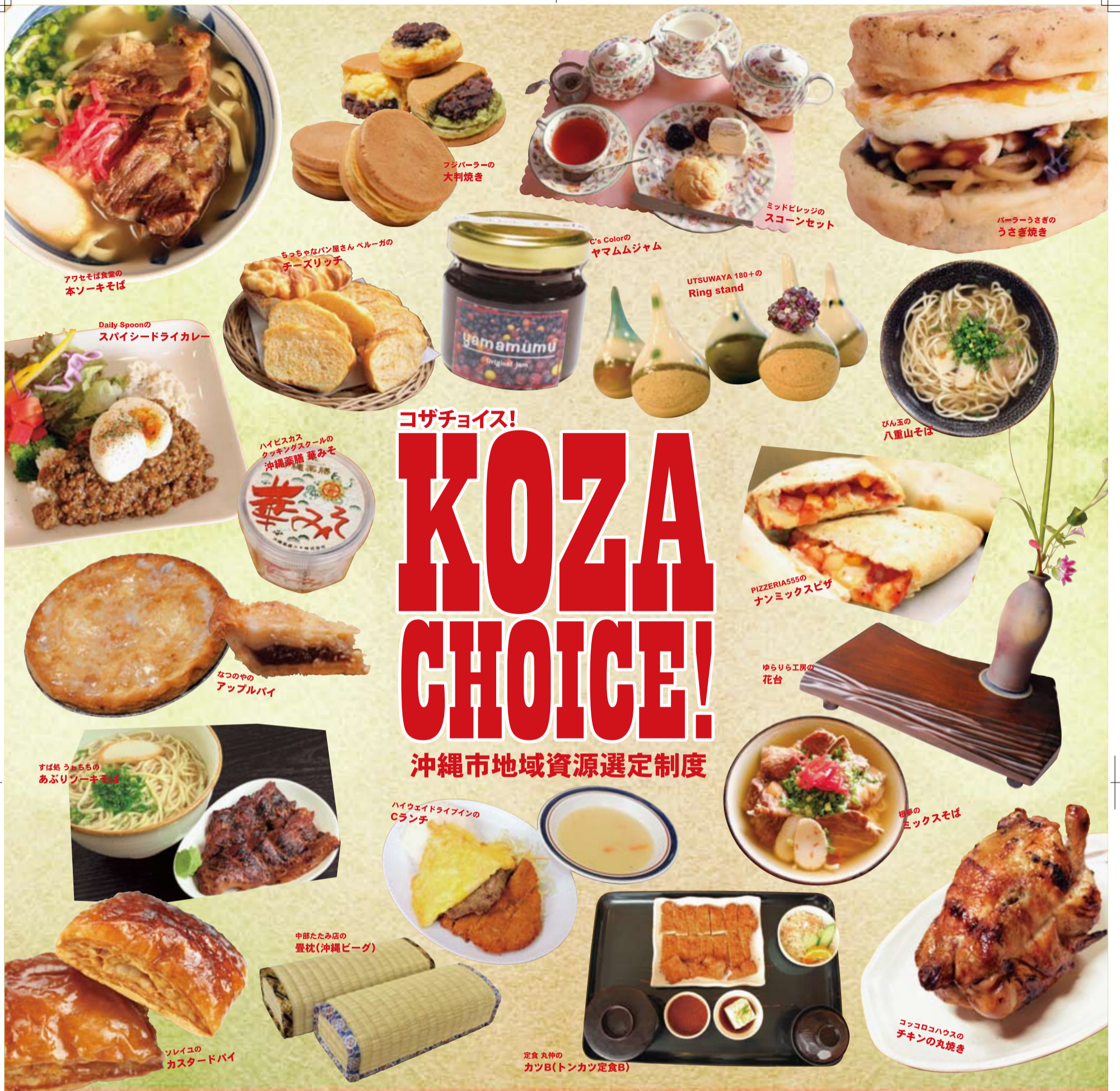
アワセそば食堂の本ソーキそば